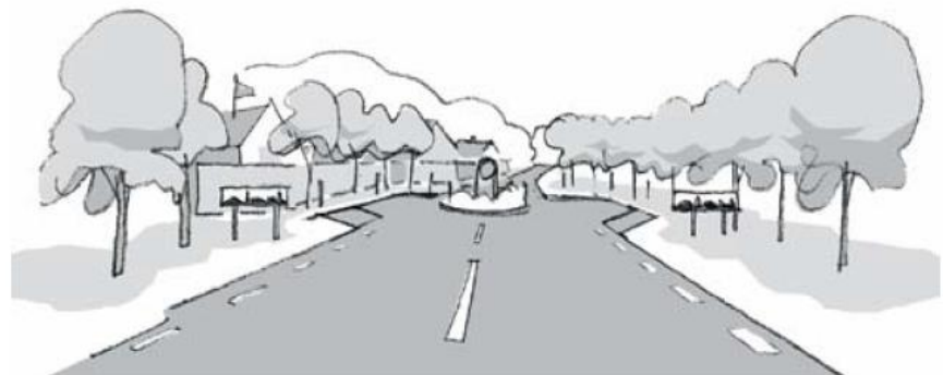
Bild 9: Avsmalning med port, bild från VGU (Vägars och gators utformning)

Port är en fartdämpande åtgärd som är lämplig vid entrén till en tätort eller ett område i en tätort. Avsmalningen och fartdämpningen kan utformas som en förskjutning, gupp, cirkulationsplats eller förträngning. Fartdämpningen kan även utformas med planteringar, beläggning, portaler m.m.