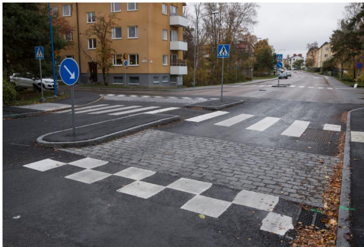
Bild 3: Upphöjt övergångsställe med refug och påfartsramp samt lång nerfartsramp