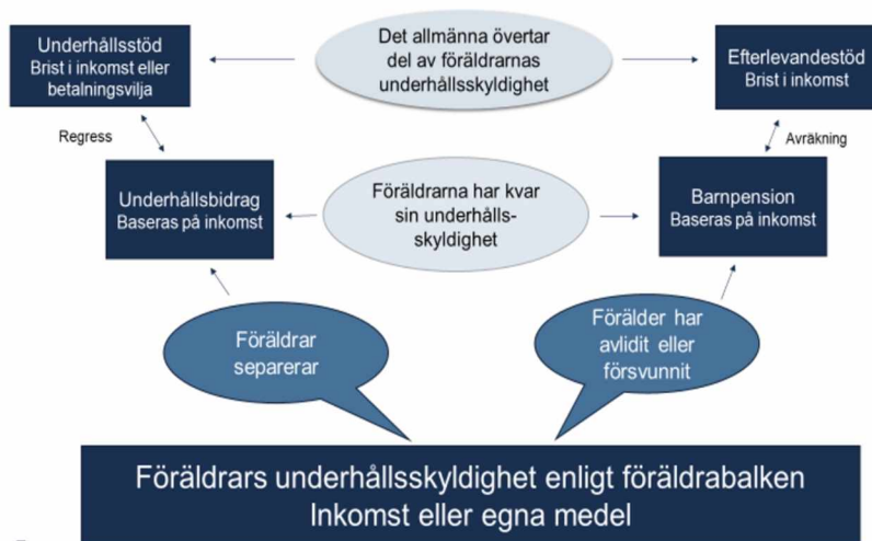
Figur 4.1 Struktur grundskydd till barn, vars föräldrar brister i sin underhållsskyldighet

Pensionsmyndigheten ansvarar för administrationen av efterlevandestödet. Bestämmelserna om efterlevandestöd finns i 76–79 kap. SFB.