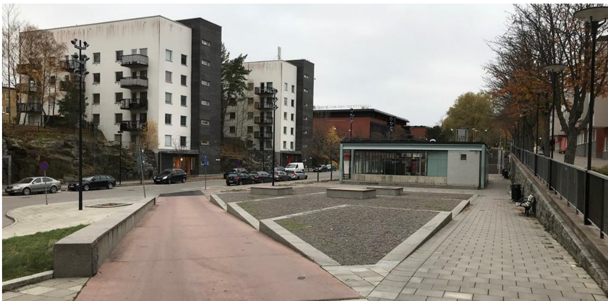
Östra delen av Tenstaplan. Här syns bland annat två av de ramper som leder upp till Tenstagång liksom den ödsliga grusyta utgör den norra entrén till centrumområdet.