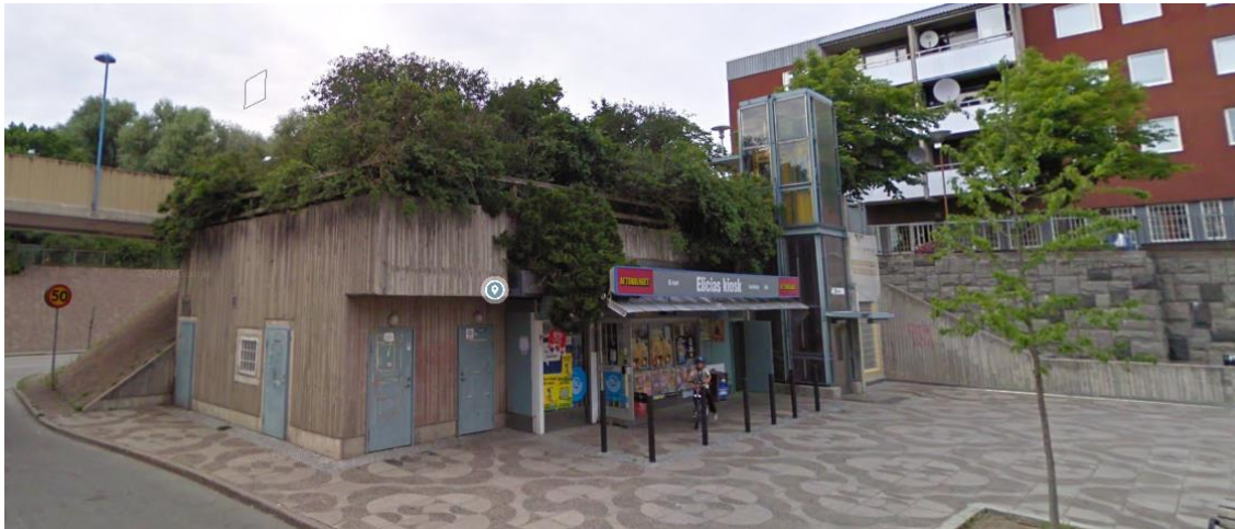
Terrassen i anslutning till hissen från Tenstaplan. Vegetationen skymmer siktlinjerna från polisens övervakningskamera.

På den östra ödsliga delen av torget iordningställs trevligare vistelsezoner för att stärka platsens identitet och för möjlighet till nyttjande av flera grupper människor än idag. Platsen skulle t.ex. kunna användas mer av de boende i "Tensta Torn" som i stor utsträckning saknar egen gårdsmiljö.