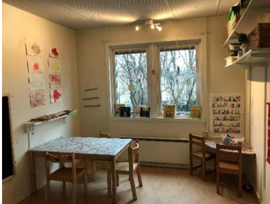
Ordningsställda bord för språklek och skapande på avdelningen för tvååringar. Viss del av materialet är placerat på höga hyllor.

avdelning Fiolen under övriga tider på dagen. I anslutning till avdelning Saxofonen (5-åringar) finns ett rörelserum.