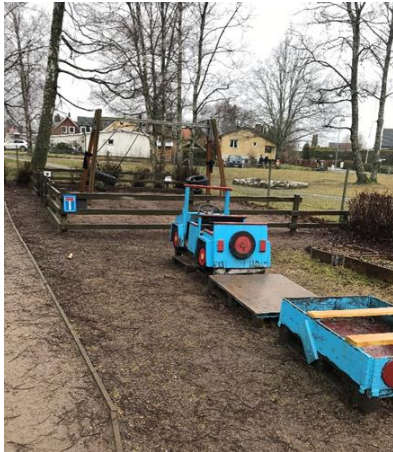
Det finns gott om fasta lekinstallationer

Förskolan har tillgång till egen gård som sträcker sig runt nästintill hela huset. Gården är uppdelad i tre delar, två stora och en liten. De större gårdarna är formade i vinkel runt huset. För att öka möjligheten att ha uppsikt över alla barn delar avdelningarna upp sig på de större gårdarna. Den ena gården används främst av avdelningarna med barn 4-5 år och den andra gården används främst av barn 1-3 år. På gården för de yngre barnen finns en grind som hindrar att barnen går runt hörnet utan uppsikt. Den minsta gården används av samtliga avdelningar vid särskilda tillfällen. På gårdarna finns gott om fasta lekinstallationer