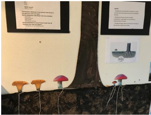
Väggdokumentation kring en avdelnings projektarbete

På avdelningarna för de äldre barnen var projektet synliggjort med dokumentation i den pedagogiska miljön, medan sådan dokumentation saknades på avdelningarna för de yngre barnen.