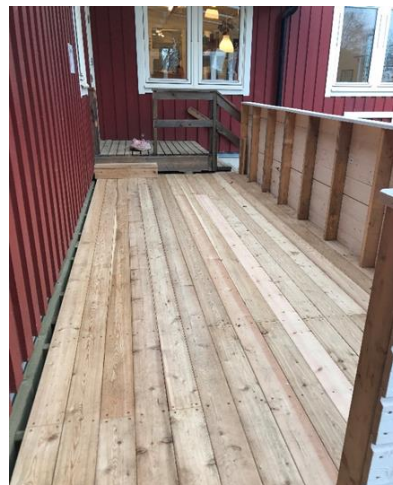
Altan med tak som används för barnens vila

På gårdarna finns bärbuskar, äppel- och päronträd och odlingslådor. Rektorn berättade att odling är ett återkommande inslag i undervisningen. Barnen är delaktiga i planeringen av odlingen och avdelningarna börjar med att så inomhus, innan skotten planteras ut i odlingslådorna.