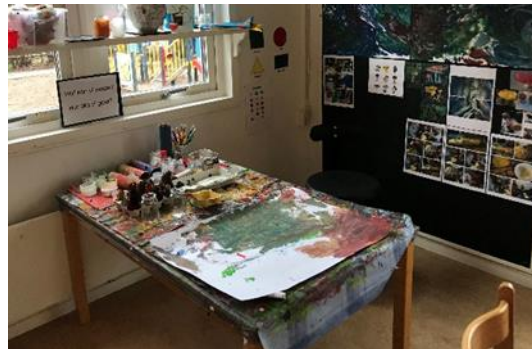
Material och dokumentation kopplat till avdelningens projektarbete står framme hela dagen.

På en avdelning fanns material kopplat till projektarbetet framställt under hela dagen. Detta förhållningssätt kan bjuda in till att barnen själva får möjlighet att bearbeta och reflektera över det som projektet handlar om eller att ta initiativ till att driva vidare det pågående projektet.