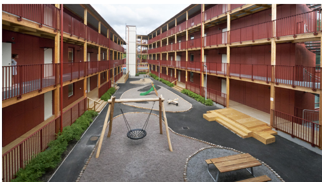
Ett av de områden med genomgångsbostäder som vi invigde under 2020, på Personnevägen i Västertorp.

Vår ambition är att ingen ska känna sig diskriminerad i kontakten med oss. Sedan några år tillbaka finns en fråga om upplevd diskriminering i den kundenkät som skickas ut till