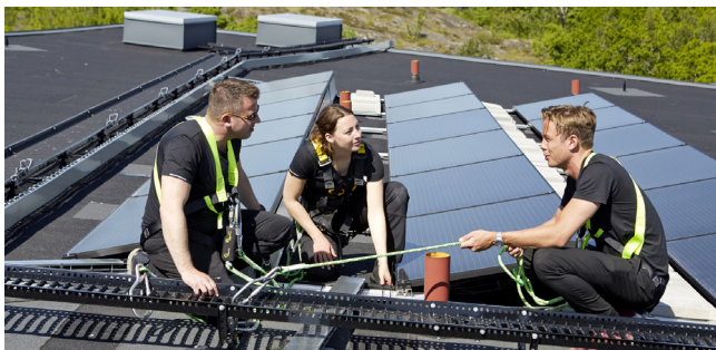
Under året invigde vi en stor solcellsanläggning på ett tak i Årstadal.

På Stockholmshem arbetar vi strategiskt för att öka vår produktion av förnyelsebar energi. Möjligheten att installera solceller ska alltid utvärderas när vi bygger nytt och bygger om. Under 2019 tog vi fram en strategi och plan för solcellsutbyggnad och ökade vår producerade solenergi med 30 procent. 2020 ökade den med ytterligare 80 procent. Vårt långsiktiga mål för solceller följer stadens miljöprogram – 5 550 kWp installerad effekt år 2040, vilket motsvarar 10 procent av vår elförsörjning.