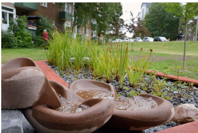
Vattentrappan och växtbädden i Gröna Solberga där vi testar nya sätt att ta tillvara på regnvatten.

Vi medverkar även i två projekt inom Vinnova, Sveriges innovationsmyndighet. Ett om hantering av dagvatten på kvartermark, och ett om utvecklingen av gröna täta tak.