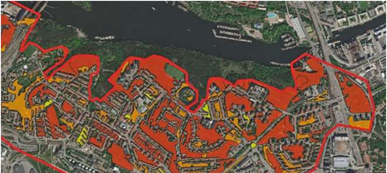
Karta 2: Utsnitt ur karta med bedömning av naturvärden i Årsta. Endast ytor utanför befintligt naturreservat har ingått i inventering och bedömning.

De ytor som ingick i reservatsförslaget 2014, tillsammans med ytterligare några områden, bedöms utgöra de mest strategiska för att bibehålla Årstaskogens ekologiska funktion som kärnområde. Ytorna är också viktiga för att upprätthålla kommunalt betydelsefulla ekologiska spridningssamband. Dessa ytor framgår av karta 3.