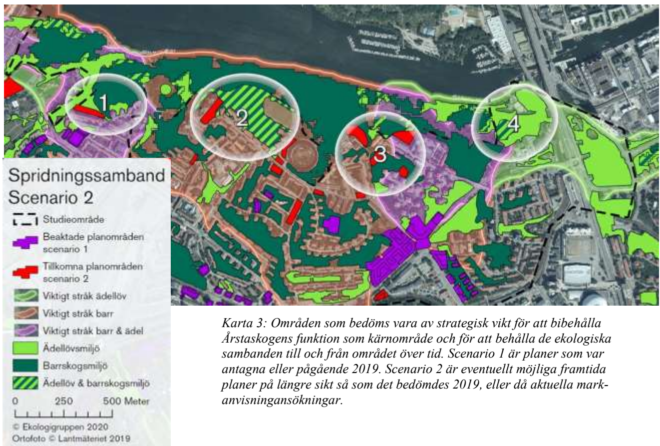
Karta 3: Områden som bedöms vara av strategisk vikt för att bibehålla Årstaskogens funktion som kärnområde och för att behålla de ekologiska sambanden till och från området över tid. Scenario 1 är planer som var antagna eller pågående 2019. Scenario 2 är eventuellt möjliga framtida planer på längre sikt så som det bedömdes 2019, eller då aktuella markanvisningsökningar.

De ytor som ingick i reservatsförslaget 2014, tillsammans med ytterligare några områden, bedöms utgöra de mest strategiska för att bibehålla Årstaskogens ekologiska funktion som kärnområde. Ytorna är också viktiga för att upprätthålla kommunalt betydelsefulla ekologiska spridningssamband. Dessa ytor framgår av karta 3.