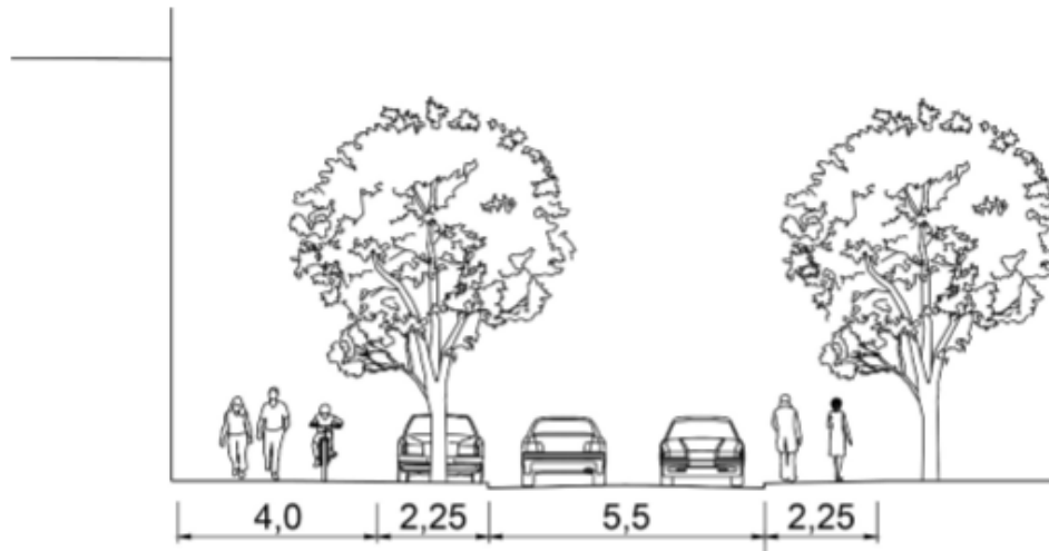
Figur 2: Typsektion gaturum Grantivägen, vid allaktivitetsbus