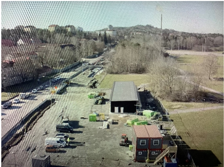
Bild över servicebyggnaden.