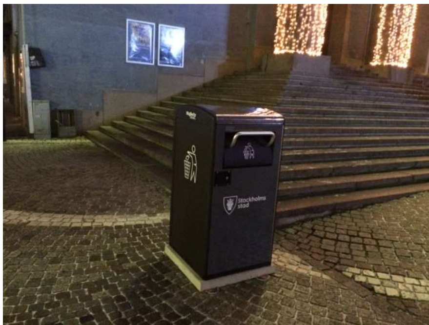
Komprimerande sopkärl som drivs av egengenererad solcellsel

Komprimering av avfallet och tömning då kärlet är fullt kan leda till färre transporter om det kombineras med anpassning av arbetssätt och tömningsfrekvenser. Eftersom kärlet är stängt minskar också risken för att fåglar och andra skadedjur kommer åt avfallet vilket minskar risken för nedskräpning. Kontoret har för avsikt att ansöka om klimatinvesteringsmedel för att finansiera kommande investeringar i komprimerande sopkärl.