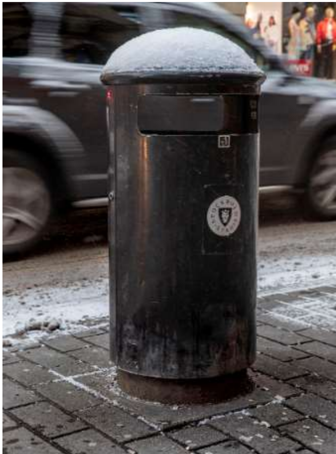
En av stadens ca 12000 skräpkorgar

Ett stort antal av de befintliga skräpkorgarna är relativt små och därmed inte anpassade för dagens livsstil där det är vanligt att köpa med sig mat i olika typer av förpackningar som snabbt kan fylla upp en skräpkorg. Trafikkontoret och stadsdelsförvaltningarna arbetar därför med en långsiktig plan för att byta ut äldre korgar mot större papperskorgar och till komprimerande kärl, bland annat på platser som periodvis har många besökare som t.ex. parker, torg och andra stråk. I samband med utbyte av skräpkorgar kommer samtliga nya utrustas med askkopp för uppsamling av fimpar. För att minska risken att skräp hamnar i vattnet där det är svårt och dyrt att samla upp är det extra viktigt att t.ex. badplatser, kajer, bryggor och strandnära lägen har en effektiv avfallshantering och städning. Antal och placering av skräpkorgar kan också anpassas utifrån årstid och olika händelser eftersom det i hög grad kan påverka besöksantal och beteenden på platsen.