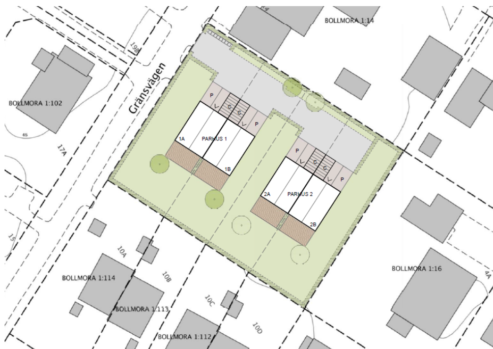
Figur 2. Illustrationsplan över planerad bebyggelse som byggaktören skickade in vid ansökan om planbesked.

Kommunen bedömde i planbeskedet att förslaget är förenligt med översiktsplanens intentioner om förtätning av området. En enskild avstyckning bedömdes inte innebära några negativa konsekvenser i sig, men att flera avstyckningar sammantaget kan ge negativa konsekvenser. På grund av det har en inventering och bedömning om förtätning i Lindalen tagits fram, vilken visar att förtätning av Bollmora 1:13 är möjlig. Inventeringen beskrivs under tidigare ställningstaganden.