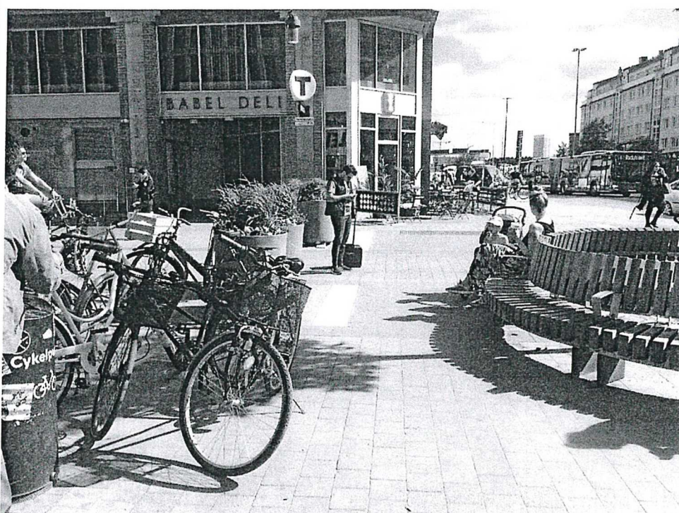
Torgytan i mötet med Hornsbruksgatan, dagsläge med möblering och cykelparkering som gör platsen svåröverblickbar, trång och upplevd av många som otrugg