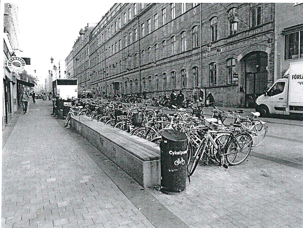
Hornsbruksgatan från väster, dagsläge med cykelparkering som begränsar framkomlighet och överblickbarhet