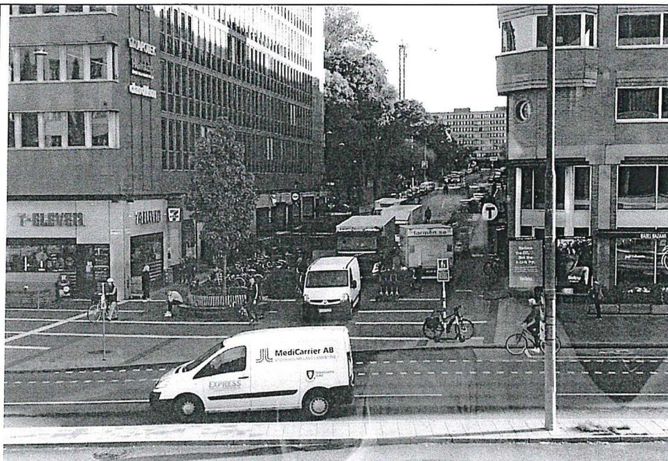
Hornsbruksgatan från öster, dagsläge med förbjuden biltrafik och parkering