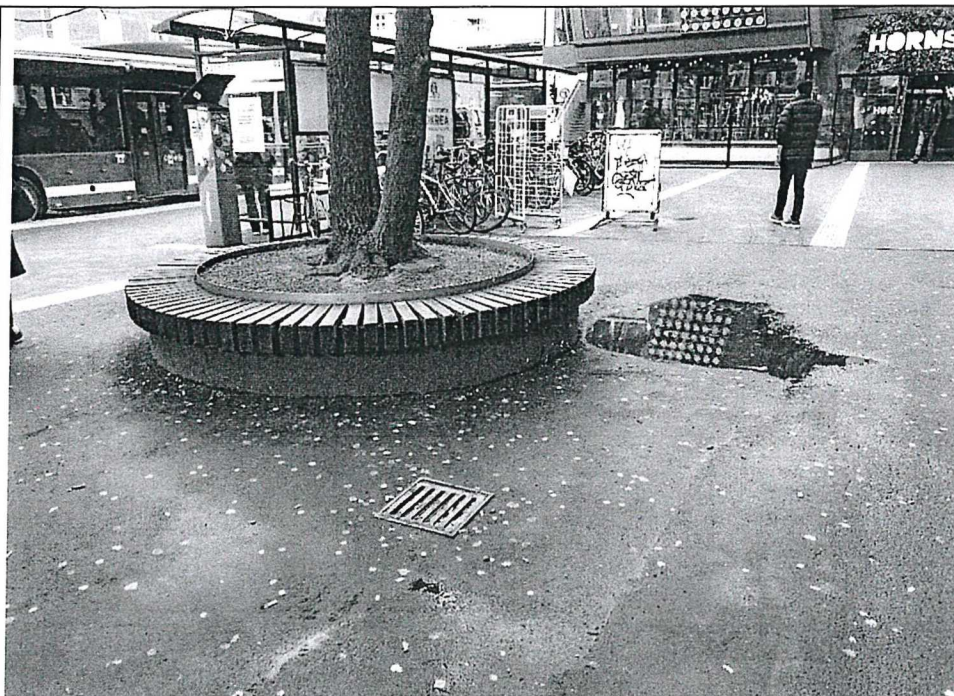
Befintligt träd som vuxit sig för stort för platsen samt med uppträngande rötter i beläggningen (tillfälligt lagad yta med asfalt). Dagvatten- och luftningsbrunnar med bristande funktion.