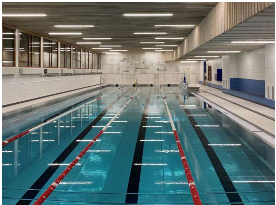
Nyrenoverad simhall med en ny rostfri simbassäng och konstverk av keramiska plattor och glasprismor i bakgrunden.

Projektet är genomfört enligt stadens projektmodell för projekt under 50 mnkr. Fastighetsnämnden är projektägare och fastighetskontoret ansvarar för projektleveranser och koordinering med berörda förvaltningar. Projektet genomförs i samarbete med idrottsförvaltningen i egenskap av hyresgäst och verksamhetsutövare. Idrottsförvaltningen har följt projektet kontinuerligt och bland annat ansvarat för kontakter med föreningsliv samt avtalsdiskussioner med andrahandshyresgäster.