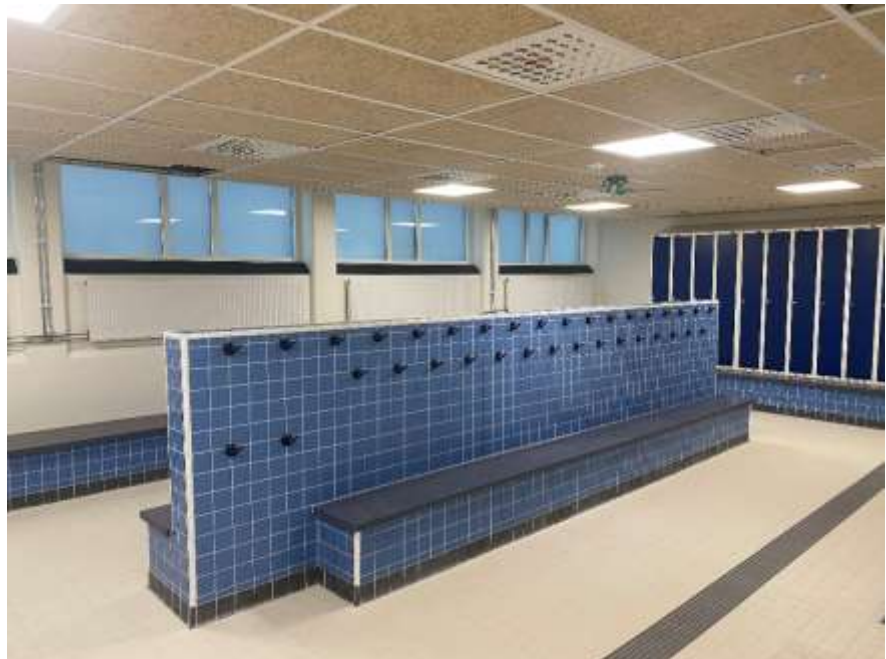
Nyrenoverade omklädningsrum med ledstråk för synskadade.