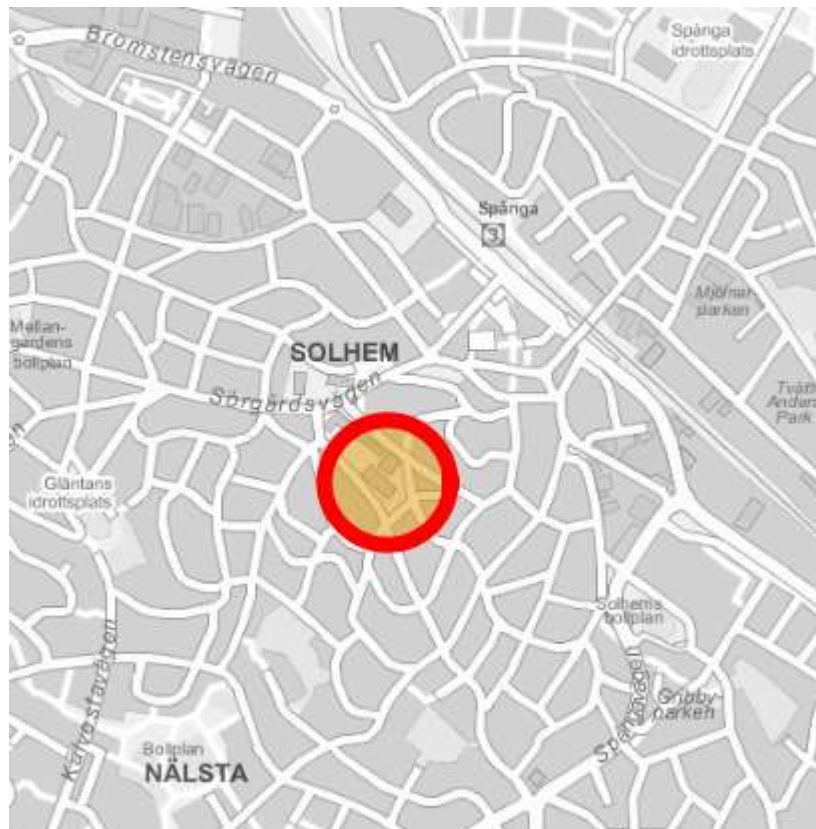
Spångahallen/Spångabadet ligger i Solhem.