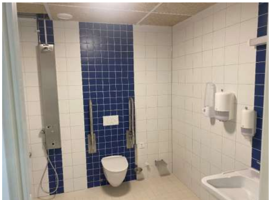
Flertalet nya toaletter som är anpassade för rörelsehindrade.