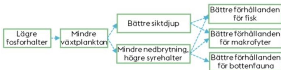
Figur 4. Följdeffekt av en minskad fosforbelastning.

En minskning av fosfor förväntas resultera i en minskad förekomst av växtplankton. Det i sin tur leder till ökat siktdjup samt mindre nedbrytning på botten vilket ökar syrehalten. Sammantaget bedöms en minskad fosforbelastning och efterföljande effekter leda till en förbättrad livsmiljö för bottenfauna, fisk och makrofyter i Mälaren-Ulvsundasjön, se figur 4. Det bedöms dock inte som möjligt att uppnå god ekologisk status till år 2021, vilket är gällande miljö kvalitetsnorm för Mälaren-Ulvsundasjön. Det kommer även att vara svårt att nå god ekologisk status för samtliga kvalitetsfaktorer till år 2027 eftersom vattenlevande djur och växter även påverkas av andra faktorer som miljögifter, klimatförändringar och fysisk påverkan. Det tar även tid innan situationen i sjön blir så bra att statusen kan anses vara god.