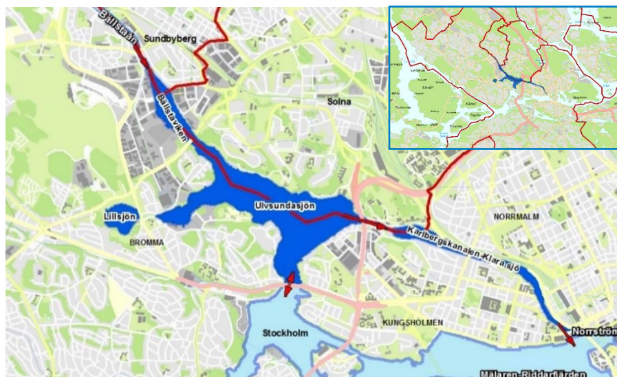
Figur 2. Mälaren-Ulvsundasjön med dess vattenområden; Bällstaviken, Lillsjön, Ulvsundasjön och Karlbergskanalen-Klara Sjö. I kartan finns även röda pilar som åskådliggör huvudsakligt vattenutbyte och flödesriktning mellan Mälaren-Ulvsundasjön och närliggande vattenförekomster. I det övre högra hörnet syns en översiktlig karta som visar vattenförekomstens läge.

Nedan följer en kort beskrivning av de tre vattenområdena i Mälaren-Ulvsundasjön och de olika påverkanskällorna i respektive område. För mer information om påverkanskällor se påverkansanalys i Bilaga B.