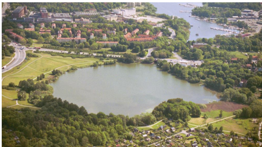
Bild 3. Flygfoto över Lillsjön där Margretelundsviken i Ulvsundasjön syns i bakgrunden.