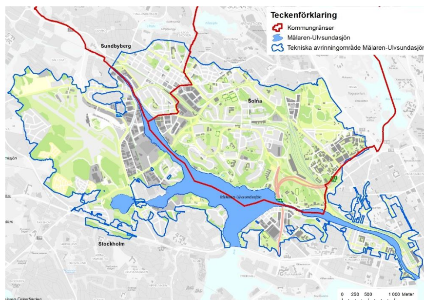
Figur 1. Mälaren-Ulvsundasjöns tillrinningsområde. Det tekniska tillrinningsområdet som avvattnas mot Mälaren-Ulvsundasjön är markerat i blått och kommungränser markerat i rött.

Tillrinningsområdet för Mälaren-Ulvsundasjön, delas av tre kommuner, se figur 1. Den största delen, nästan 57 procent, ligger i Stockholms stad, drygt 36 procent i Solna stad och 7 procent i Sundbybergs stad. Detta dokument har tagits fram i samarbete mellan de tre kommunerna.