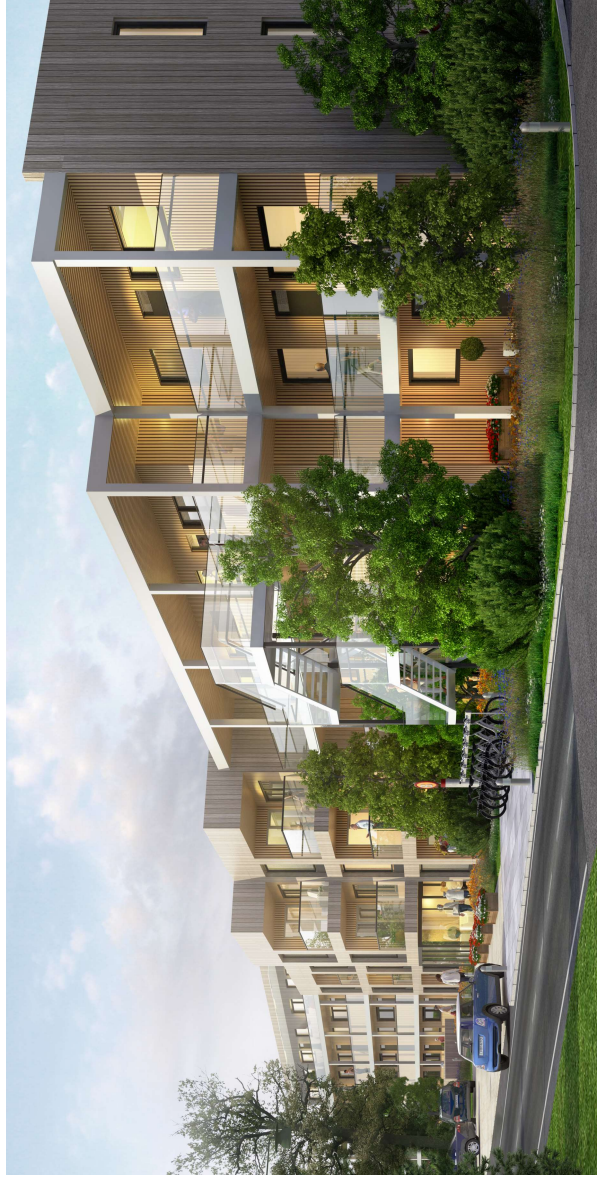
Fasader mot Apelvägen