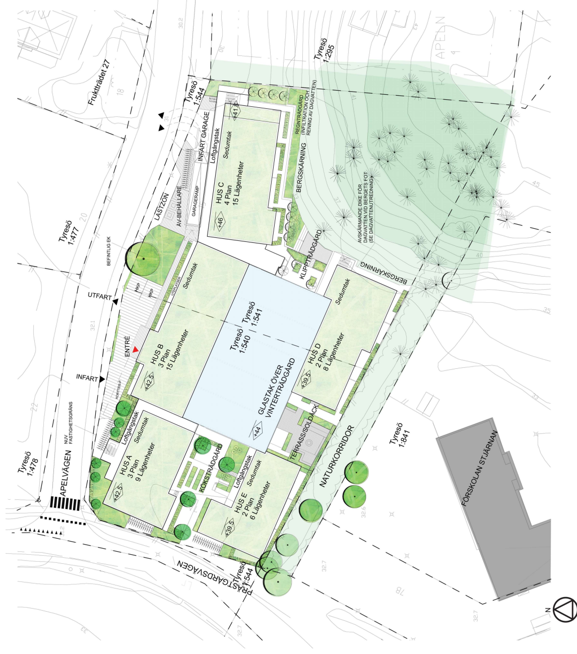
Situationsplan för södra planområdet