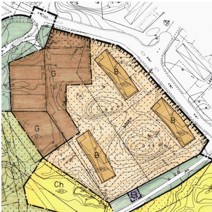
Utsnitt ur befintlig detaljplan 162.