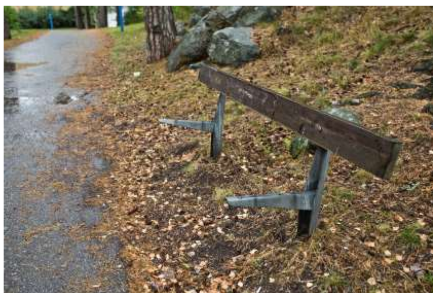
Bild före renovering.