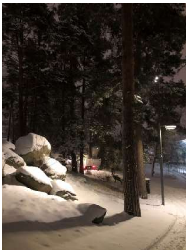
Bild efter reovering.