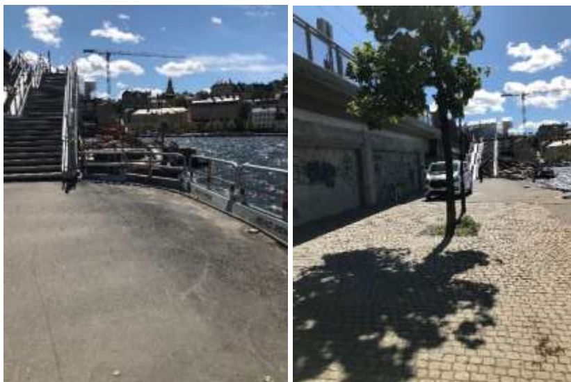
Munkbron idag med pågående ombyggnation. Hösten 2021 lämnas platsen tillbaka till trafikkontoret.

rullstolsburna eller barnvagnar. Kontoret har därför för avsikt att behålla den gestaltning som finns på Munkbron men att föra in ett stråk med granithällar som passar bra in i området samtidigt som tillgängligheten förbättras. Vidare finns idéer om att på samma gång byta ut skräpkorgar och parkbänkar, anlägga nya växtbäddar och komplettera belysningen, vilket skulle öka platsens attraktivitet ytterligare.