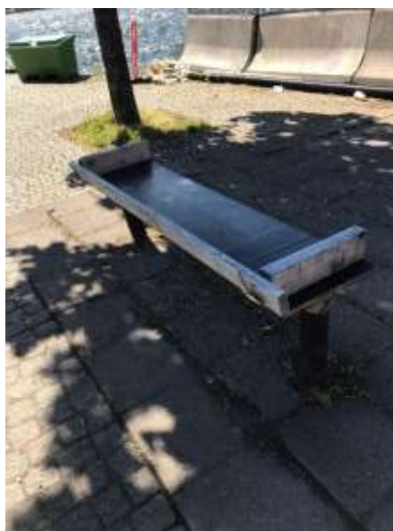
Munkbron idag där medborgare på eget bevåg har renoverat parkbänkar.

Ytterligare ett exempel på åtgärd är gång- och cykelbanan längs med en skola på Gotlandsgatan på Södermalm. I dagsläget skapar