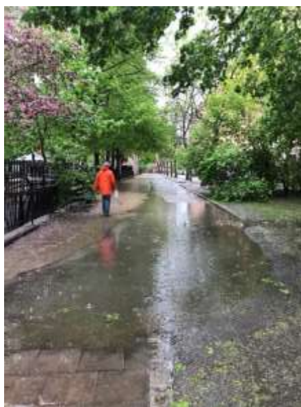
Gotlandsgatan under ett regnoväder.

den slitna beläggningen på denna sträcka problem med vattenavrinningen, vilket leder till att det vid regn skapas stora vattenpölar som inte rinner undan. Kontoret har redan tidigare utfört åtgärder för att förbättra trafiksäkerheten kring skolan och att genomföra reinvesteringar för att förbättra beläggningen på denna kombinerade gång- och cykelbana skulle ytterligare höja trafiksäkerheten och attraktiviteten intill skolan. Insatsen skulle gynna både gående och cyklister som passerar skolan.