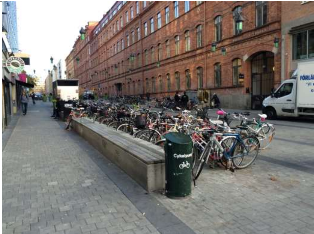
Hornsbruksgatan från väster, dagsläge med en cykelparkering som begränsar framkomlighet och överblickbarhet