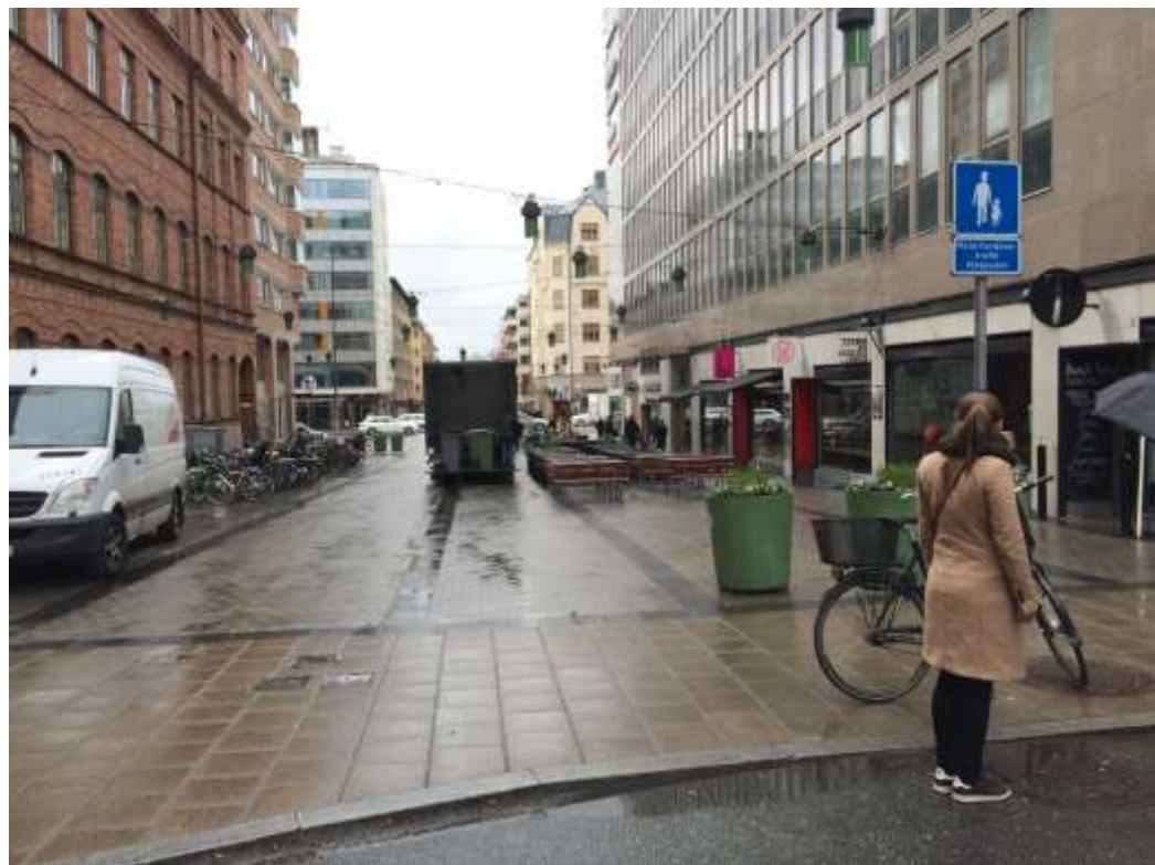
Hornsbruksgatan från öster, dagsläge med förbjuden biltrafik och parkering