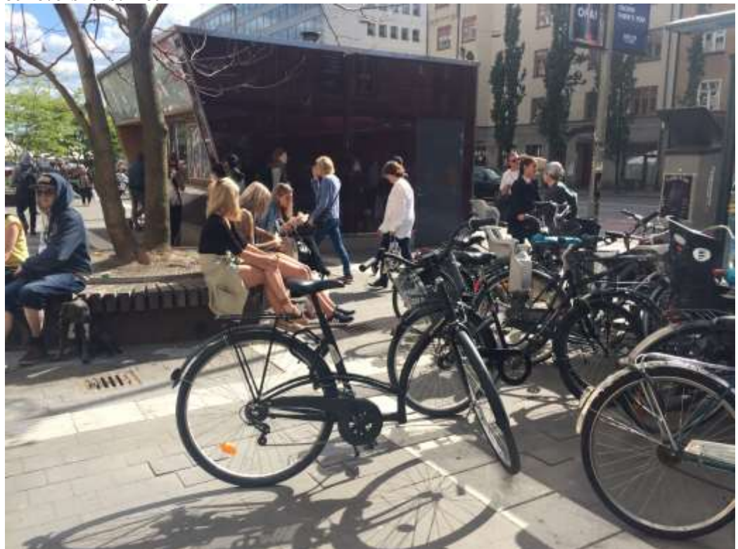
Torgytan bakom busshållplatserna, dagsläge med en stor mängd cykelparkering som gör platsen svårframkomlig