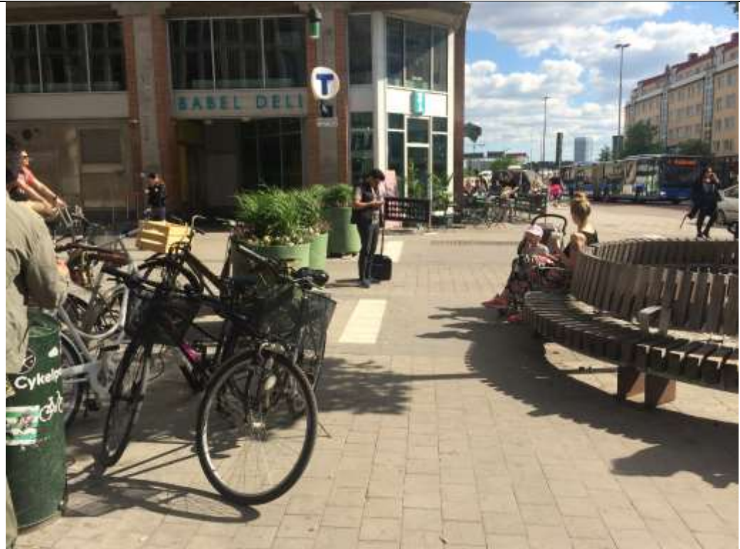
Torgytan i mötet med Hornsbruksgatan, dagsläge med möblering och cykelparkering som gör platsen svåröverblickbar, trång och upplevd av många som otrygg