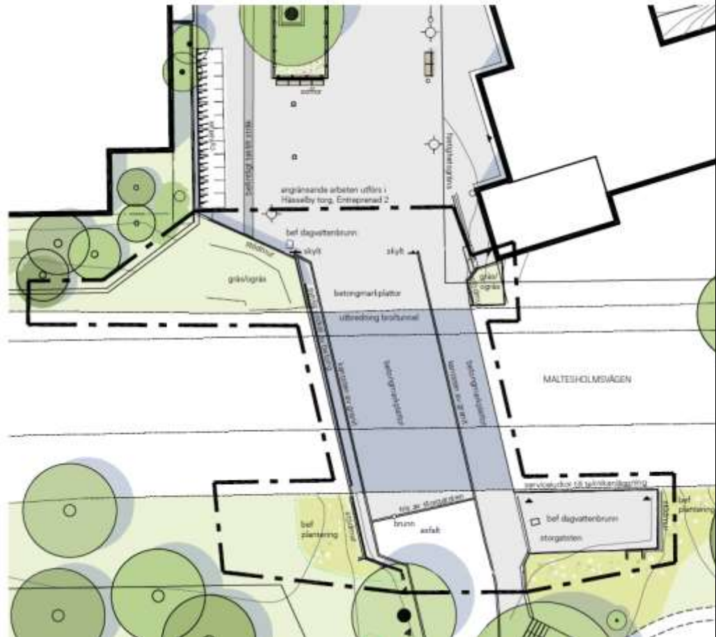
Illustration av den befintliga situationen. Ur bilaga 1 Hässelby gångtunnel trygghetsskapande åtgärder

på så vis skapa en oväntad positiv första upplevelse av Hässelby gård. Tunneln präglar i mycket Hässelby genom att den utgör en entré till torget. Därför krävs här större omtanke än vad som ryms inom en ordinarie upprustning.