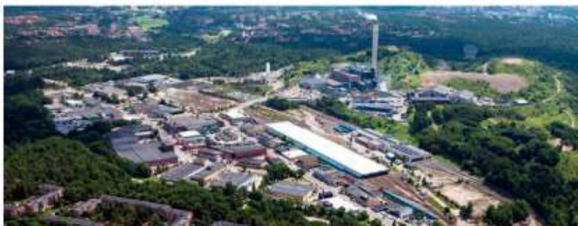
Figur 2. Högdalens industriområde omgivet av Högdalstopparna. Högdalenverket med den höga skorstenen syns till höger om flygfotots mitt.

Detaljplanen har varit på granskning och kan antas när genomförandebeslut är taget. Projektet innebär viss utvidgning av Högdalens industriområde söderut. Områden av icke-planlagd mark och allmän plats för park tas i anspråk för den nya kvartersmarken. Viss industrimark föreslås ändras till allmän plats för natur. Se figur 2 och 3 nedan.