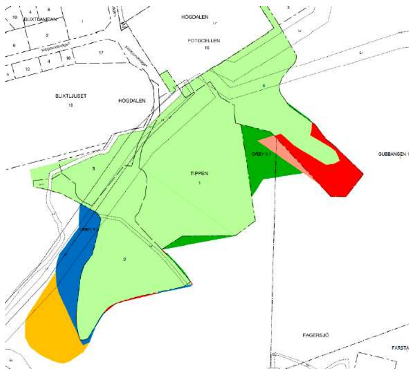
Figur 3. Illustration över ändrad markanvändning från detaljplanens planbeskrivning. Ljusgrön = fortsatt kvartersmark. Mörkgrön = ändras från allmän plats för park till kvartersmark för värmeverk eller avfallssortering. Ljusröd = fortsatt allmän platsmark, men ändrad från park till natur. Mörkröd = ändras från kvartersmark till allmän plats natur. Gul = ändras från icke planlagt till allmän plats för park. Blå = ändras från icke planlagt till kvartersmark för avfallssortering m.m.