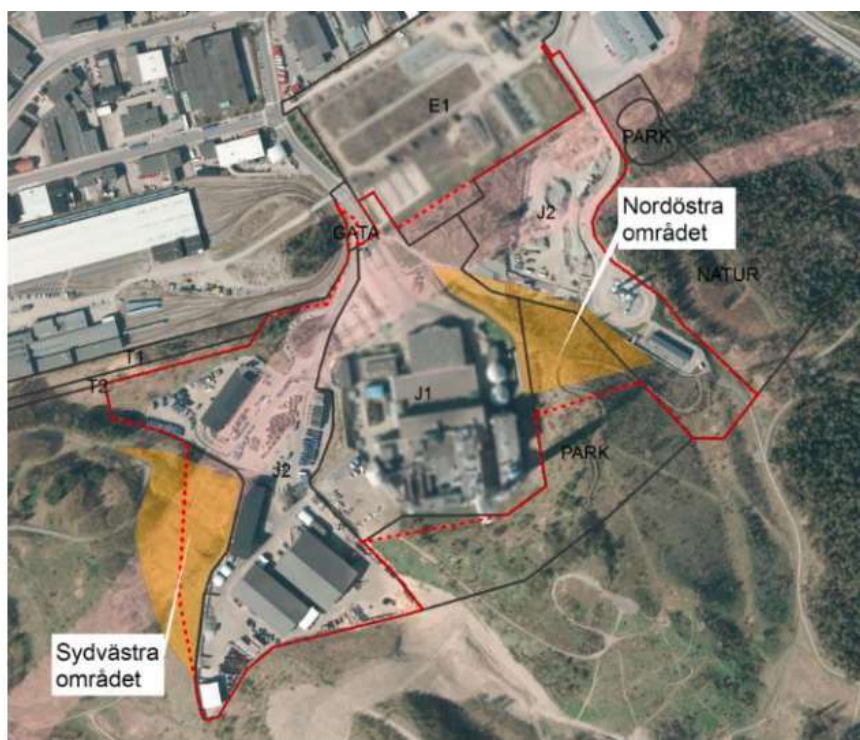
Figur 1. Ortofoto över området hämtat från Planbeskrivning, granskningshandling Dp 2015-19270

Projektet syftar till att möjliggöra för Stockholm Avfall AB, nedan SVOA, att bygga en ny matavfallsanläggning samt för Stockholm Exergi AB, nedan Exergi, att bygga ut Högdalenverket i kvarteret Tippen i Högdalen. Båda dessa åtgärder är viktiga för att staden ska kunna uppnå målet om att vara fossilbränslefritt år 2040.