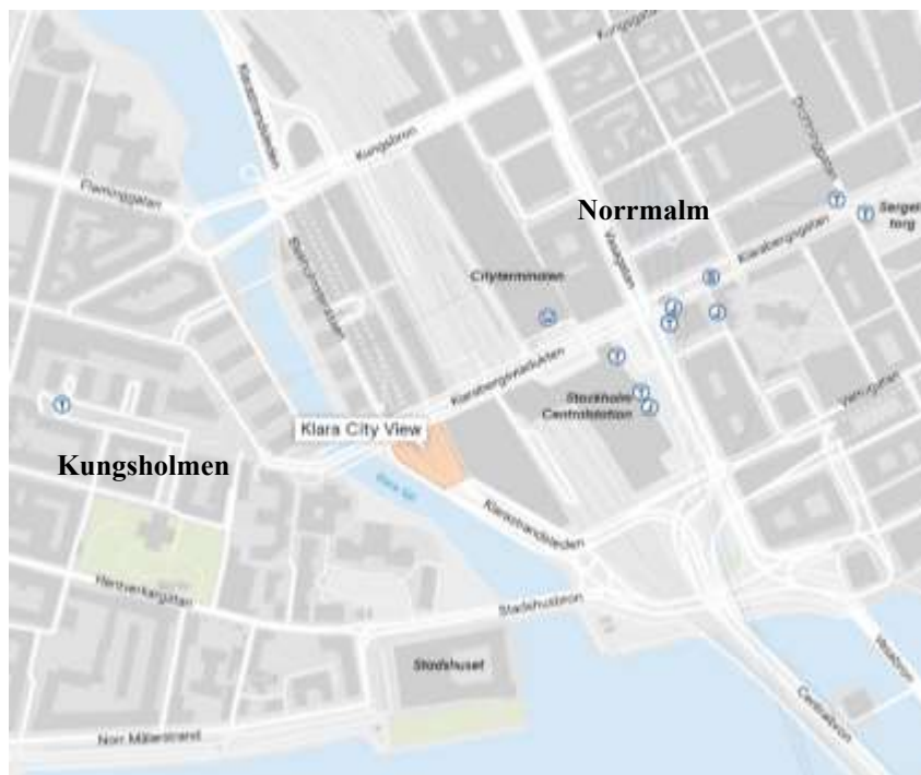
Figur 1. Markanvisningsområdet Klara City View markerat med rosa inom streckad linje.

Utbyggnaden av tomten har varit aktuell sedan Stockholm Waterfront byggdes, men då det är en trång plats med många befintliga funktioner har kontoret innan en markanvisning görs velat utreda att det finns tekniska möjligheter att genomföra ett exploateringsprojekt på denna plats. Kontoret har även utrett samt behövt fatta nödvändiga beslut om hur försäljningen ska anpassas specifikt för denna plats och detta projekt. Sedan det reviderade utredningsbeslutet i juni 2016, se Tidigare beslut nedan , har kontoret fortsatt arbetet med utredningar av platsen och hur ett projekt och en eventuell tävling skulle kunna genomföras. Kontoret kom genom dessa utredningar fram till att markanvisningen skulle genomföras genom en anbudstävling som leder till att fastigheten säljs till högstbjudande. Mer om detta under nedanstående rubrik, Markanvisningstävlingen .