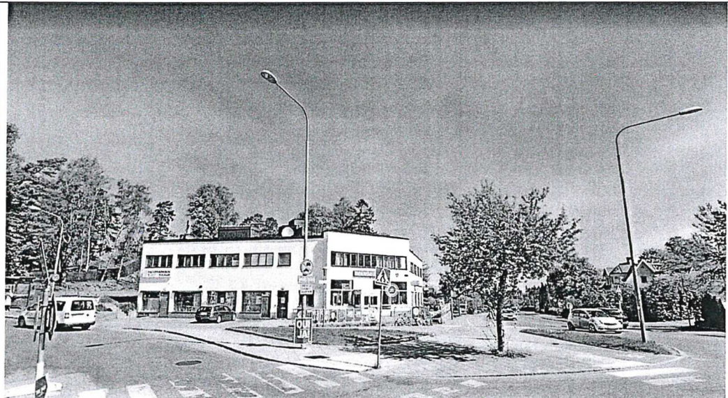
Karl Vennbergs Plats från sydväst.