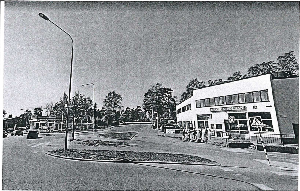
Karl Vennbergs Plats från öster.