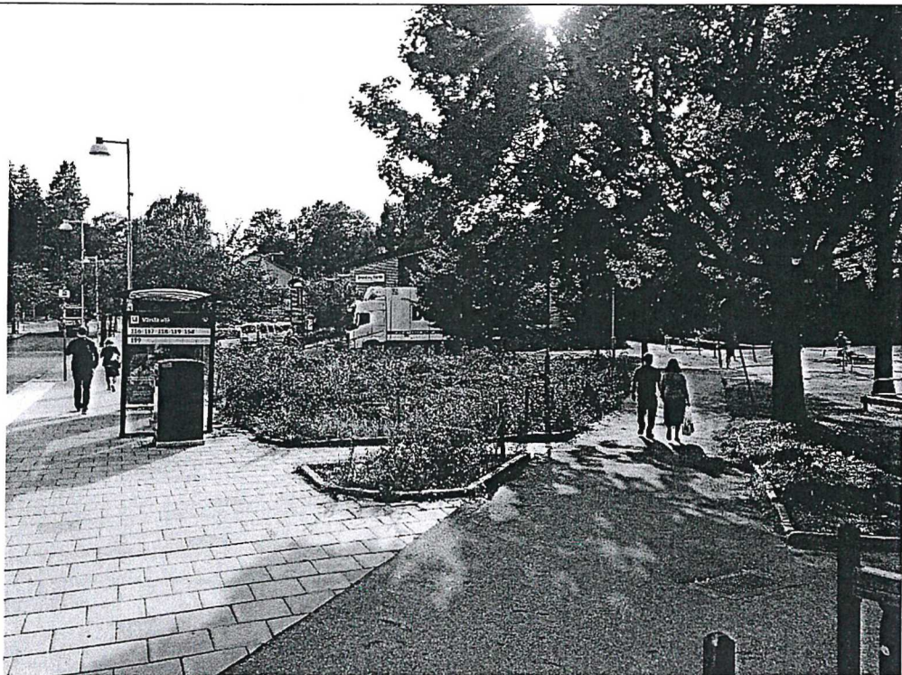
Grön platsbildning, torg/gångtorg sett från öst, Värsta Allé