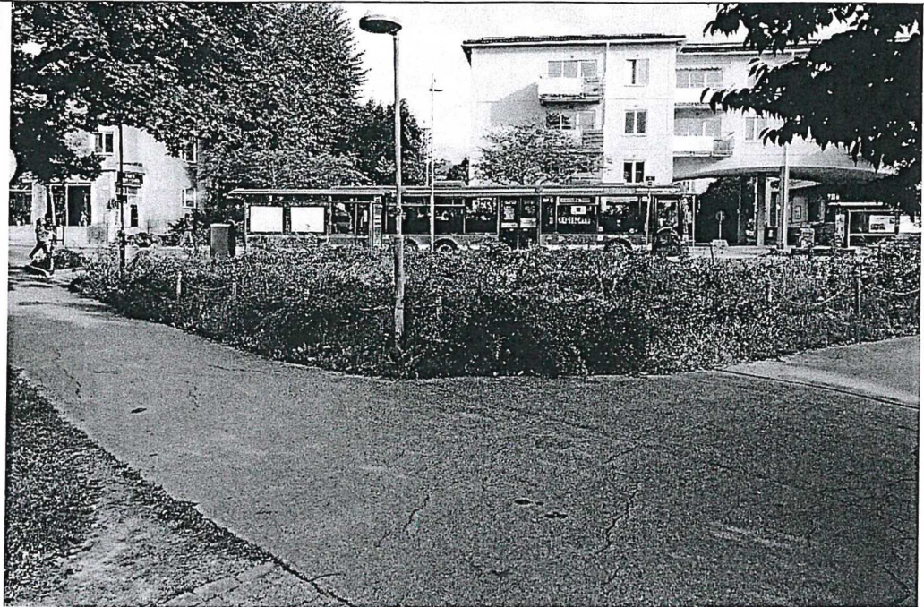
Grön platsbildning, torg/gångtorg sett från väst, park/vändplan Kronofogdevägen