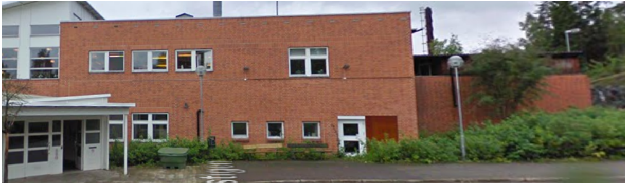
Bild 2. Våning 2 köket i tegelbyggnad och den vita delen uppe i vänstra hörnet är del av matsalen.