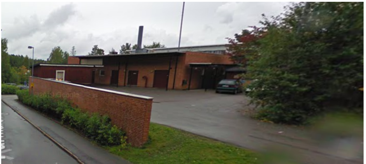
Bild 3. Köket sett från lastkajen den låga röda byggnaden är soprummet.

I Tyresö gymnasium är köket inte ombyggt. Detta med anledning av flera oberoende utredningar kring gymnasiets framtida lokalisering, dimensionering och inriktnings beslut som pågått sedan centralkökets avveckling/nedläggning 2013-2014.