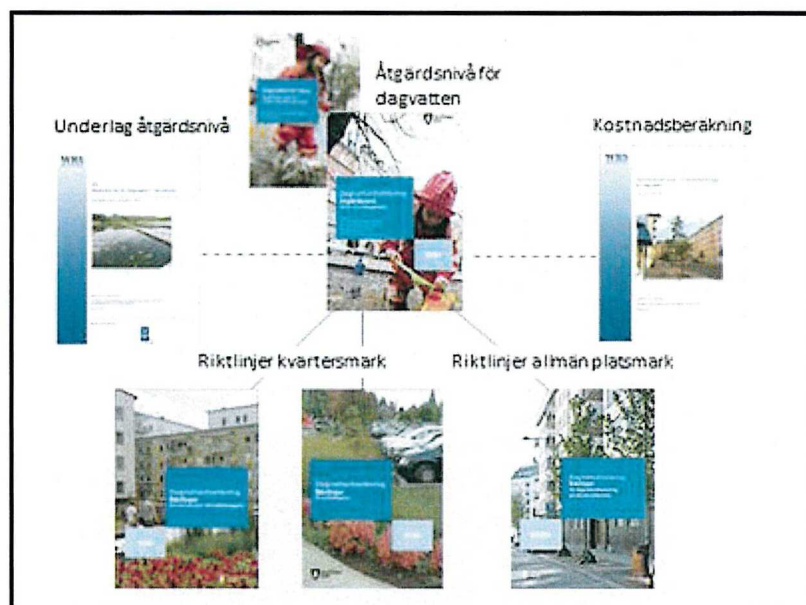
Figur 1: Förhållandet mellan olika dagvattendokument.

Riktlinjen kommer att tillgängliggöras på SVOA's dagvattenwebb ( Riktlinjer | Dagvatten ( stockholmvattenochavfall.se )) och rikta sig till de som arbetar i stadsbyggnadsprocessen och även de som gör arbeten i befintlig miljö på olika sätt, som t ex handläggare i staden, konsulter och andra.