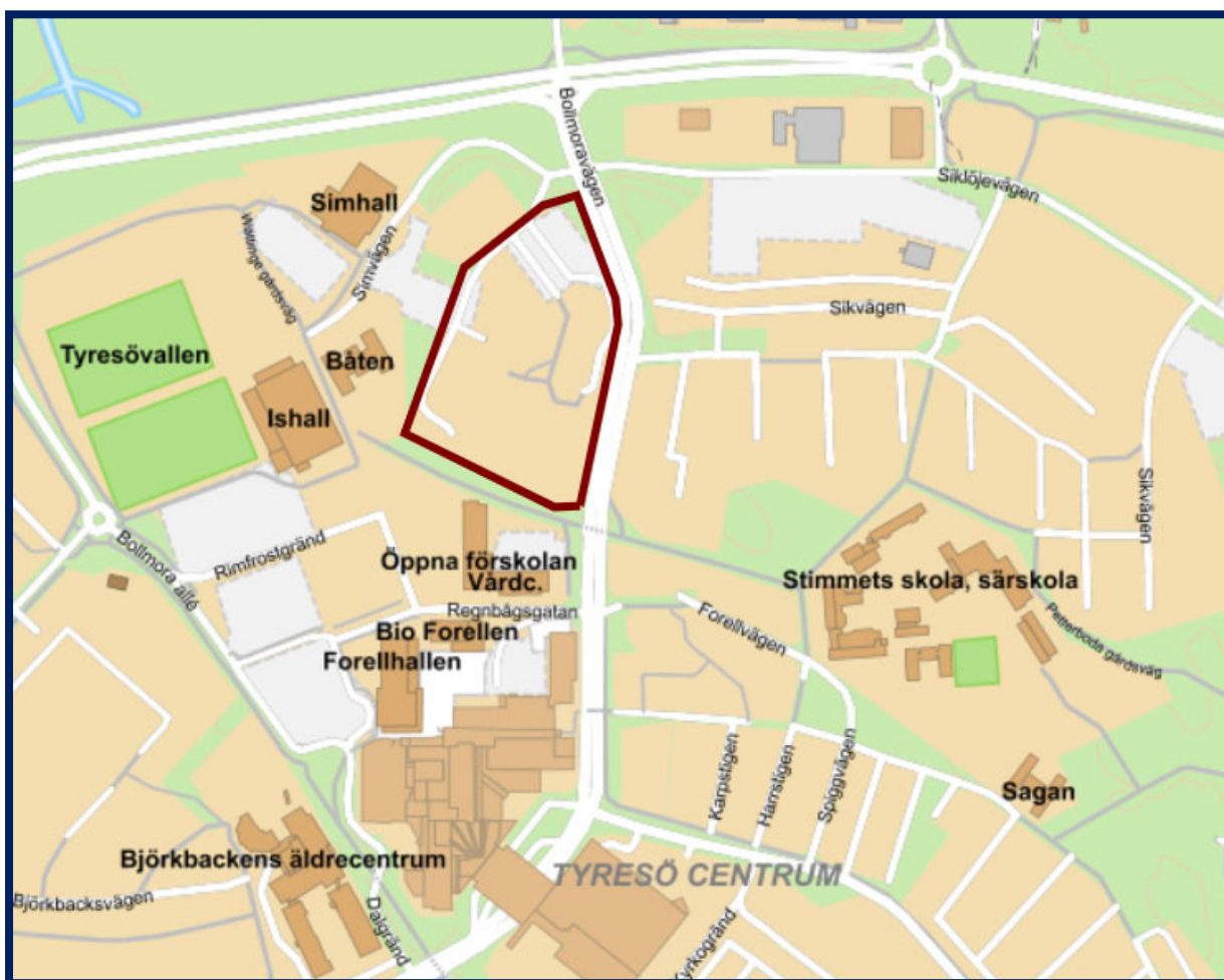
Karta som visar Tyresö centrum. Området för tomtindelning är markerad med mörkröd linje.