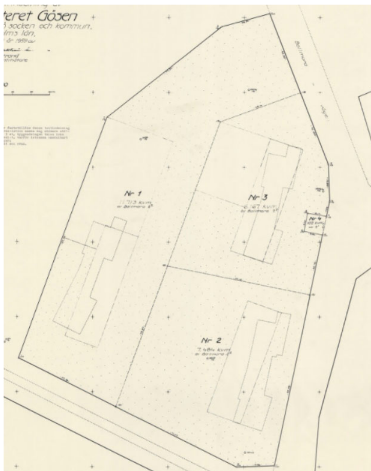
Tomtindelningsskarta för Gösen 1-4 som avses upphävas