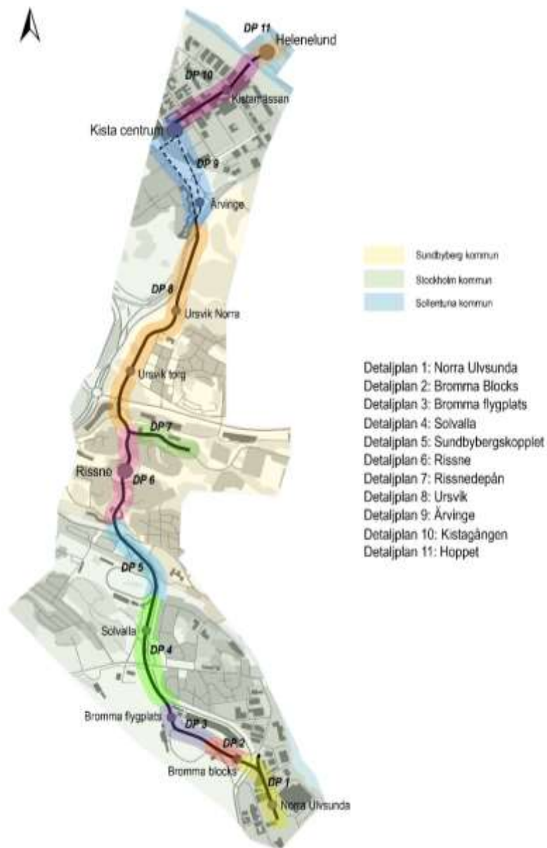
Bild 1. Kistagrenens detaljplaneindelning i Stockholm, Sundbyberg och Sollentuna