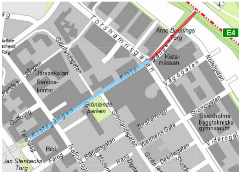
Bild 2. Huvudstråk (blått) och pendlingsstråk (rött) för cykel längs Kistagången mellan Jan Stenbecks torg och vägporten under E4

I samband med anläggandet av Tvärbanan får Kistagången en helt ny utformning (se bild 3) och allmän biltrafik ska tillåtas längs Kistagången i södergående riktning. Detta då vissa fastigheter längsmed Kistagången kräver angöring från gatan. En ny dubbelriktad cykelbana anläggs på gatans södra sida mellan Jan Stenbecks torg och Torshamnsgatan, därefter byter cykelbanan sida och fortsätter på den norra sidan förbi Arne Beurlings torg och vidare till porten under E4:an. Cykelbanan längs Kistagångens södra sida utförs med en bredd på 2,25 m samt cykelbanan längs Arne Beurlings torg utförs med en bredd på 2,5 m.