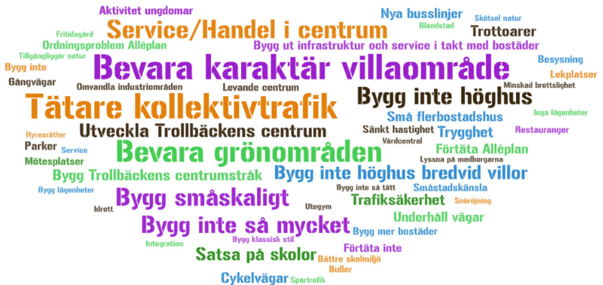
Bild 5. Ordmoln med fler svar från tre Trollbäckenbor eller fler på frågan "Vad ska vi tänka på när din kommundel utvecklas?" Trollbäckenborna vill bevara karaktären av villaområde och att det som byggs ska vara småskaligt. Utvecklingen av Trollbäcken C och byggandet av Trollbäcken centrumstråk ses generellt som något positivt vilket är i linje med den tidiga dialogen 2013.