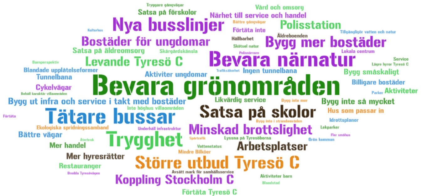
Bild 3. Ordmoln som enbart visar svaren från telefonintervjuer med 794 svaranden. Resultatet visar enbart 3 eller fler liknande svar för respektive ord. Resultatet visar att det finns en mer positiv syn på bostadsbyggande i denna grupp kontra den som aktivt vänt sig till kommunen för att svara på enkät eller delta i medborgardialog.