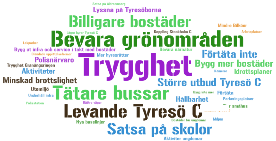
Bild 4. Ordmoln med svar från Bollmorabor på frågan "Vad ska vi tänka på när din kommundel utvecklas?" I Bollmora är Trygghet och Billiga bostäder ett vanligare svar än i andra kommundelar.