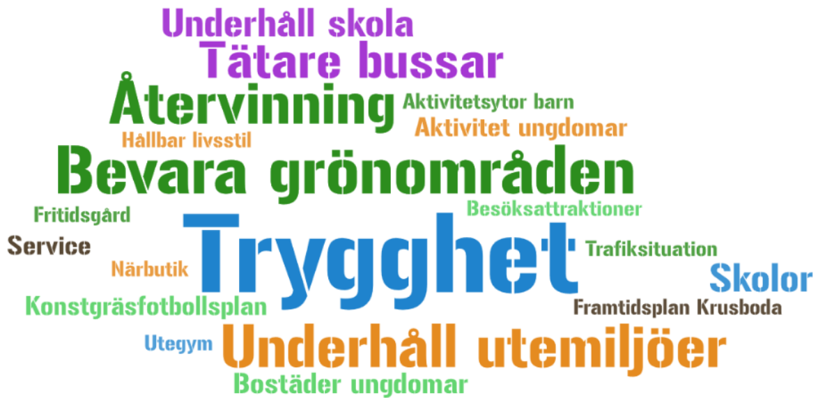
Bild 8. Ordmoln med svar med fler än 2 svaranden från Krusbodabor på frågan "Vad ska vi tänka på när din kommun del utvecklas?" Krusbodaborna lyfter särskilt fram trygghet, återvinning och underhåll av utemiljöer som viktiga frågor.