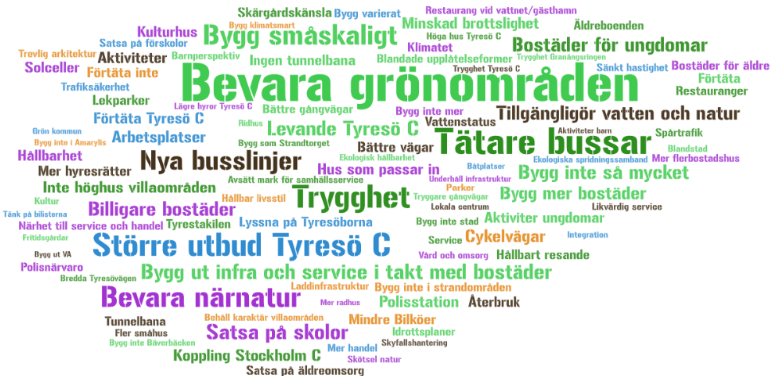
Bild 2. Ovan redovisas svar från alla insamlingsmetoder med mer än 5 eller fler liknande svar på frågan Vad ska vi tänka på när vi utvecklar framtidens Tyresö?