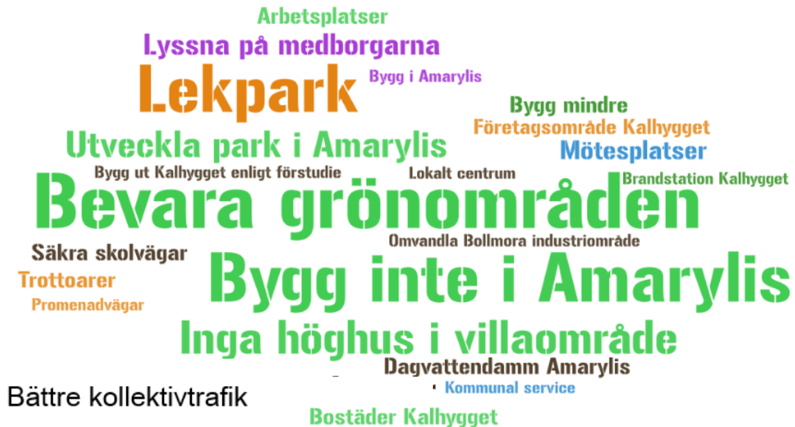
Bild 6. Ordmoln med svar med fler än 2 svaranden från Lindalenbor på frågan "Vad ska vi tänka på när din kommun del utvecklas?" För Lindalenborna är Amarylisområdets framtid en prioriterad fråga. Många Lindalenbor efterfrågar en lekpark i sin kommun del.