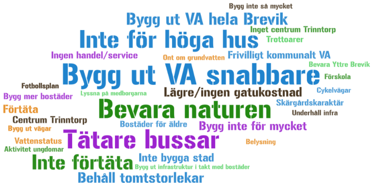
Bild 6. Ordmoln med svar från Tyresöstrandsbor på frågan "Vad ska vi tänka på när din kommun del utvecklas?" För Östra Tyresöborna är utbyggnad av kommunal VA en prioriterad fråga. Det är även angeläget för dem att kommundelen utvecklas genom småskalig bebyggelse. Resultatet ger en något annan bild än den som framkom 2013 där det fanns ett större stöd för förtätning av Brevikshalvön.