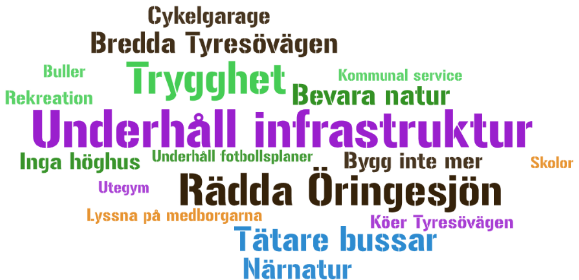
Bild 7. Ordmoln med svar med fler än 2 svaranden från Öringebor på frågan "Vad ska vi tänka på när din kommundel utvecklas?" Öringeborna är bekymrade över Öringesjön och vill att kommunen underhåller befintlig infrastruktur bättre.