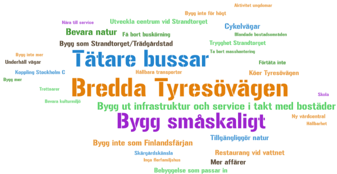
Bild 6. Ordmoln med svar från Tyresöstrandsbor på frågan "Vad ska vi tänka på när din kommun del utvecklas?" Resultatet visar enbart 3 eller fler liknande svar för respektive ord. För Tyresöstrandsborna är breddning av Tyresövägen en prioriterad fråga. Det är även angeläget för dem att kommundelen utvecklas genom småskalig bebyggelse. Strandtorget lyfts fram som ett uppskattat exempel.