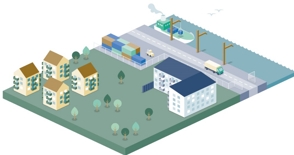
Figur 3. Hamn med ny och äldre bebyggelse i närheten. Den nya bebyggelsen till höger är bulleranpassad och lägenheterna har tillgång till en bullerskyddad sida. Därför kan högre ljudnivåer accepteras vid den nya bebyggelsen jämfört med vid den äldre bebyggelsen till vänster.