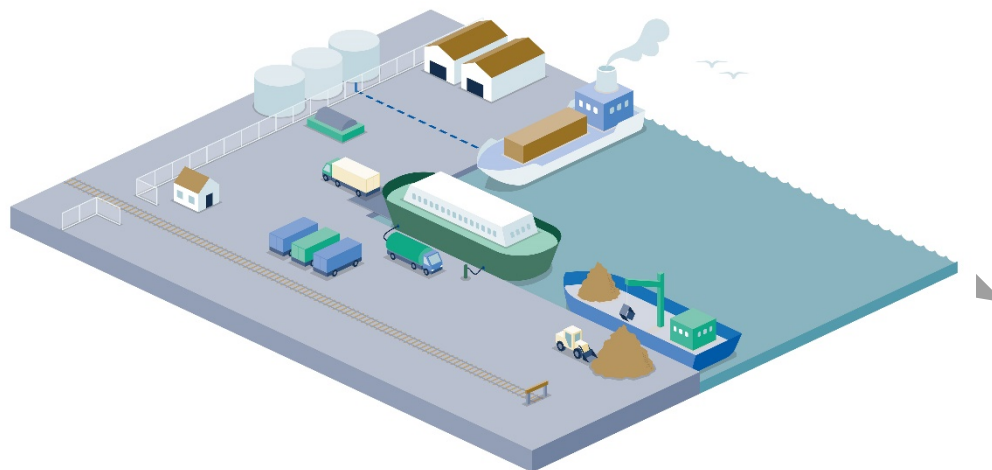
Figur 1. Exempel på en hamn med terminaler för flytande och fast bulk samt ro-ro-trafik.