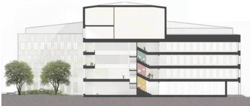
Genomskärning av skolan med atriet i mitten och idrottssalen högst upp. Bildkälla: Max Arkitekter