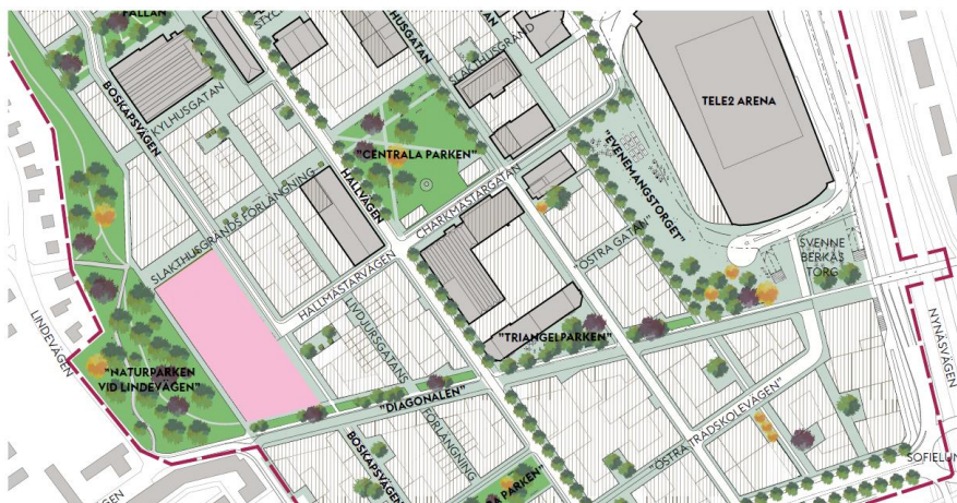
Karta över del av slakthusområdet, skoltomten markerad med rosa färg