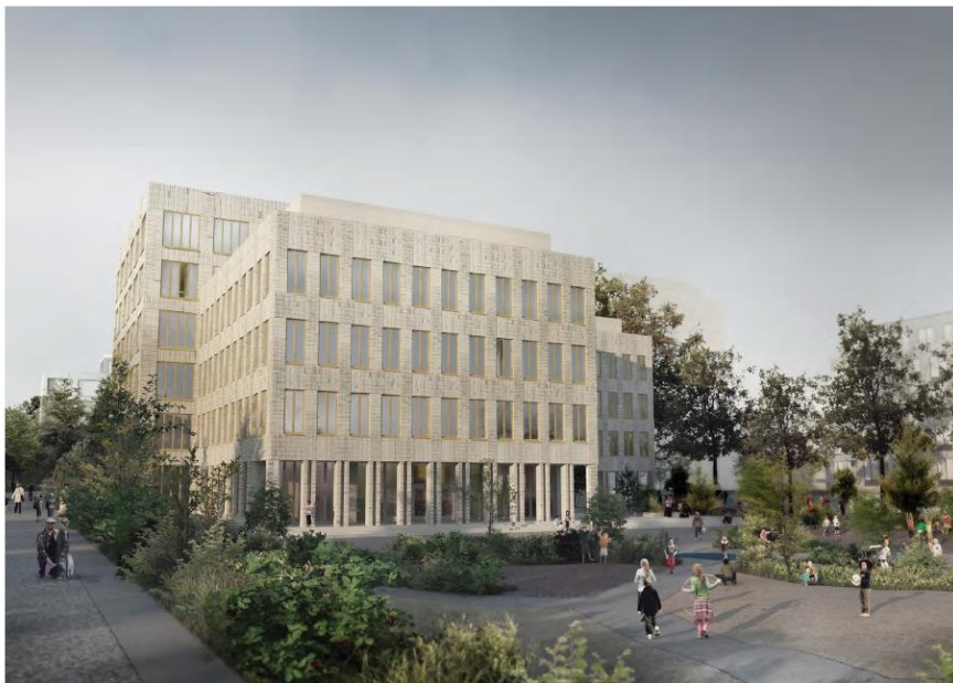
Illustration av skolan sett från söder med skolgården framför. Bildkälla: Max Arkitekter