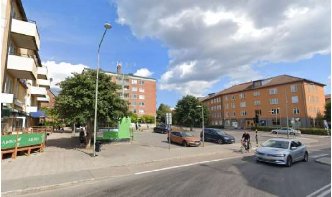
Bromstensplan idag med kiosk och en stor parkeringsyta på västra delen av torget.