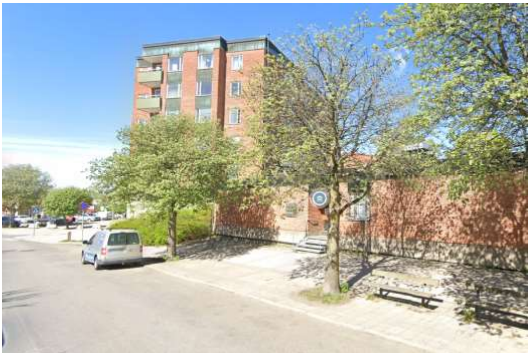
Vy från Rissnavägen.