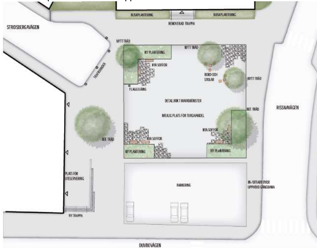
Illustration ur gestaltungsprogram för Bromstensplan