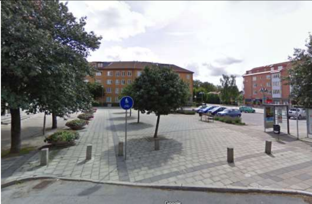
Vy från Stridsbergavägen.