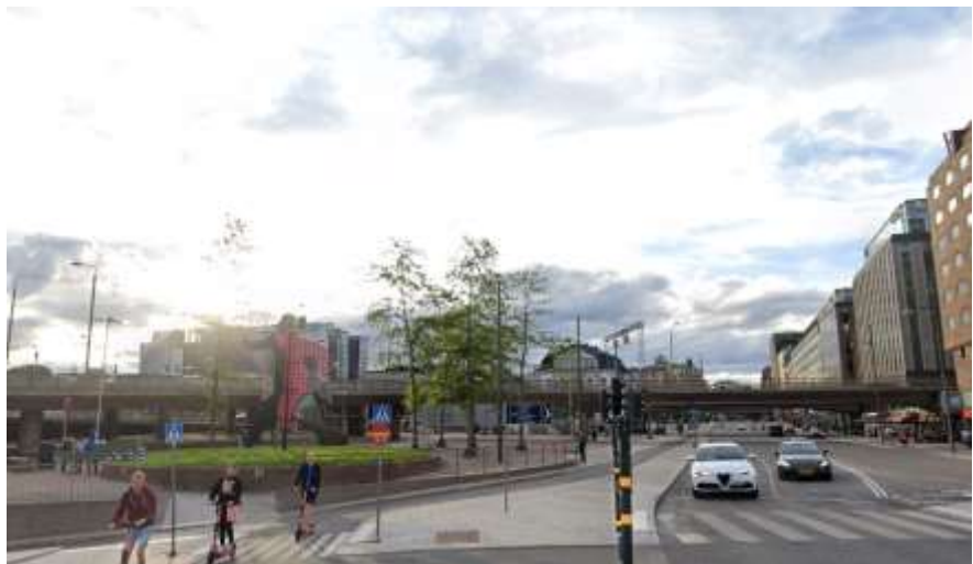
Muren ut mot Vasagatan innan rivning