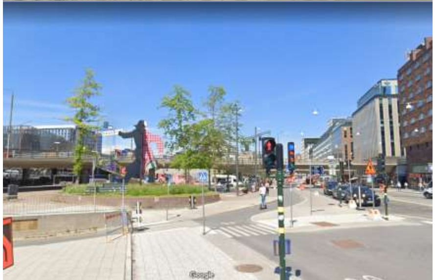
Muren mot Vasagatan borta