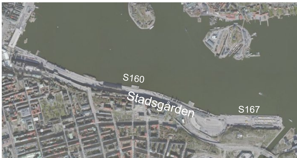
Stadsgården med kajplatser S160 och S167.

Stockholm är en populär kryssningsdestination och cirka hälften av kryssningsanlöpen inom Stockholms Hamnar går i dagsläget till de två kajplatserna S160 och S167 vid Stadsgården. Med sitt centrala läge just öster om Viking terminalen är kaj S167 Stockholms Hamnars mest eftertraktade kryssningskaj. Kaj S167 har även goda kommunikationer in till city med passagerarbåtar vilket innebär färre busstransporter i samband med kryssningsanlöp. Kajplats S167 är dock i dåligt skick och i stort behov av renovering. Utöver detta så har kajen ett begränsat vattendjup som gör att de större kryssningsfartyg som redan idag trafikerar Stockholm inte kan lägga till vid just denna kaj. Mot bakgrund av detta planeras även för en fördjupning vid kajen som möjliggör fler anlöp av större och mer moderna fartyg vilket i sin tur innebär högre nyttjandegrad.