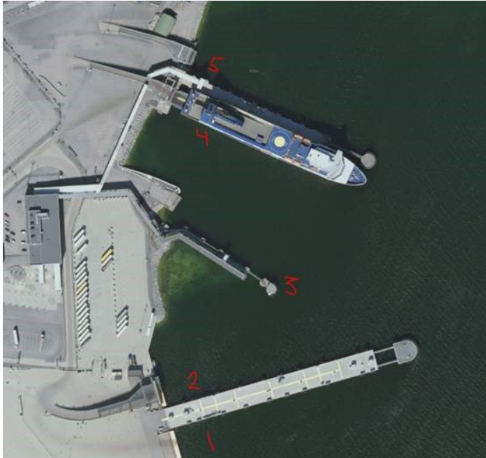
Läge K1 – K5 Kapellskärs hamn