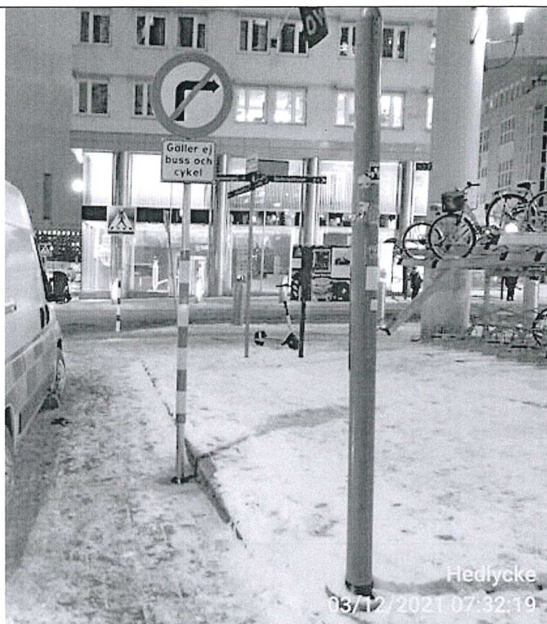
Montering av vägmärke C25-2 samt tilläggstavla på Fatbursgatan.