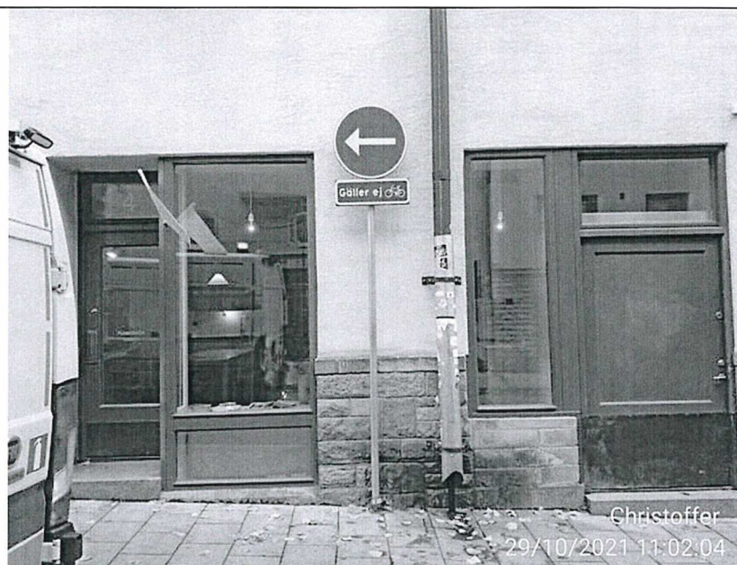
Montering av D1-1 med tillhörande tilläggstavla på Björngårdsgatan.

Beskrivning av eventuella avvikelser i projektets genomförande