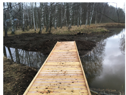
Grodamm med brygga och spång