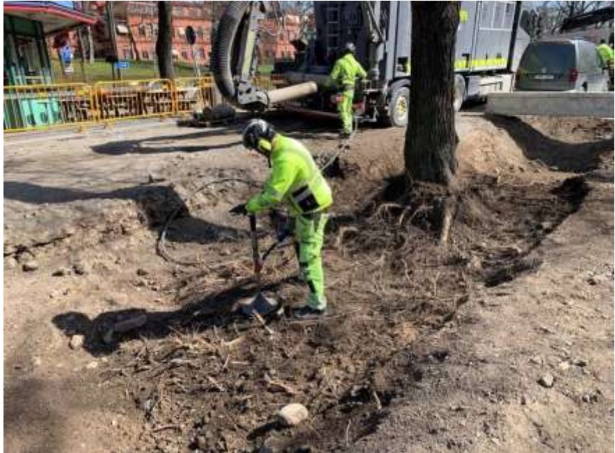
Figur 2: Gamla lindar på Valhallavägen räddas genom uppluckring av marken kring rötterna. Tryckluftslans och vakuumschakt används för att luckra upp marken samtidigt som skador på rötterna minimeras. Valhallavägen 2021.

Med anledning av att ärendet återremitterades på februarinämnden har kontoret genomfört en omprioritering av de planerade projekten för 2022 utifrån nämndens uppdrag att lägga mer fokus på vård och underhåll av gatuträden. Några av de projekt som tidigare planerats därför utgår tillsvidare.