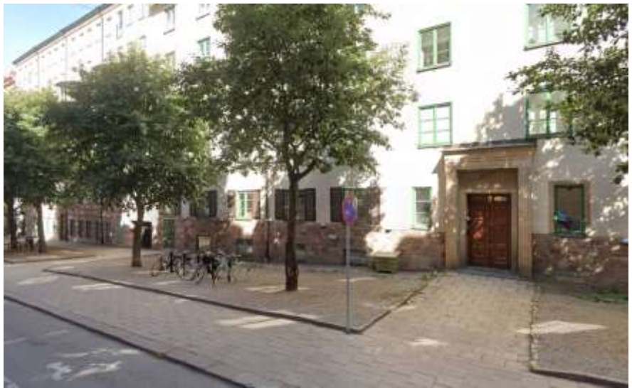
Figur 4: Oxlarna på Wollmar Yxkullsgatan.

Växtbäddsrenovering för oxlarna på Wollmar Yxkullsgatan 2-6. Arbetet samordnas med underhåll som kommer att göra i ordning beläggningen på gatan. Träden i gångbanan får nya växtbäddar med möjlighet att ta emot dagvatten.