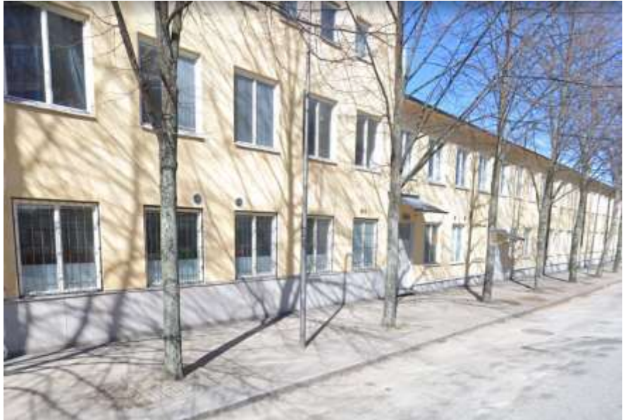
Figur 5: Lindarna på Mejerigatan, Liljeholmen. Här kommer markgallerna, vilka är placerade runt träden i gatuhöjd, att tas bort.