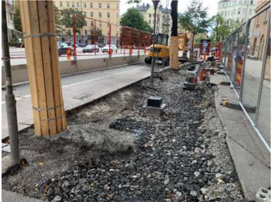
Figur 6: Nya växtbäddar för befintliga träd mellan Karlbergsvägen- Vanadisplan i etapp 1 av projektet, 2021.