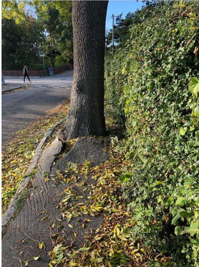
Figur 7: Träden på Pukslagargatan blockerar befintlig gångbana och skadar beläggningen.