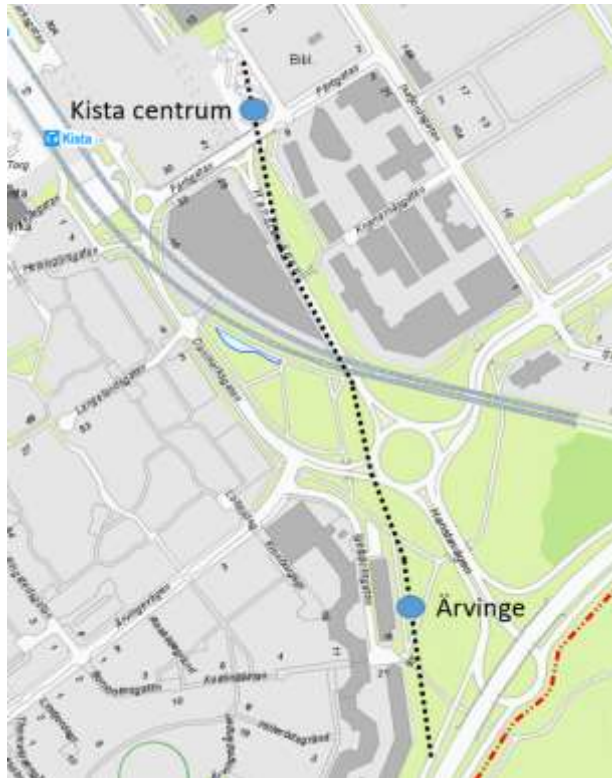
Bild 2. Kistagrenens sträckning i Ärvinge

projektera, upphandla och genomföra Kistagrenen i den omfattning som framgår av detaljplaner, systemhandlingar, gestaltungsprogram och i enlighet med genomförandeavtalet, (se bilaga 1), för sträckan inom Ärvinge.