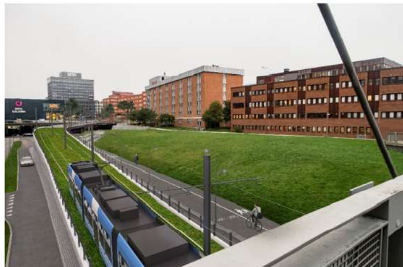
Bild 6. Visionsbild från befintlig gångbro över Hanstavägen, vy mot Kista Galleria och Jan Stenbecks torg (Treeline)

Gång- och cykelbanan längs Hanstavägens östra sida utförs med en bredd på 5 meter, vilket är i enlighet med stadens riktlinjer, och en skyddszon mellan cykelbana och körbana på 1 meter.