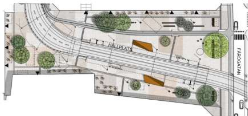
Bild 8. Föreslagen utformning av Jan Stenbecks torg

Jan Stenbecks torg är utpekad som huvudcykelstråk i Stockholms stads cykelplan. Cykling sker idag i blandtrafik på en gata som löper över torget, Torsnäsgatan, vilken kopplar samman Kistagången med Färögatan.