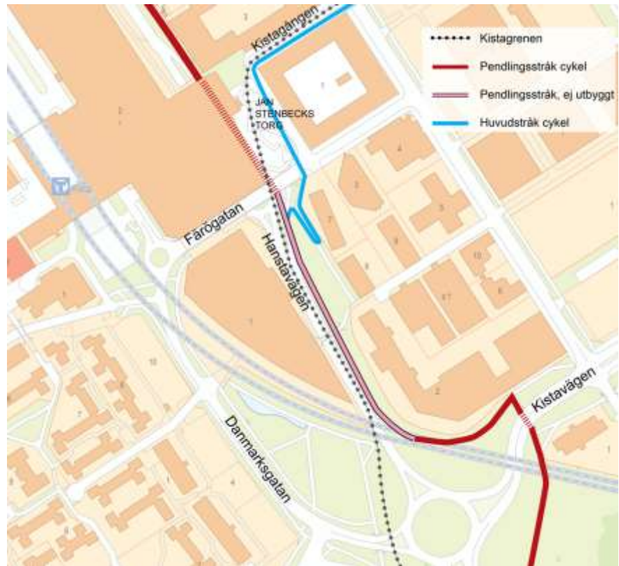
Bild 5: Befintliga stråk som kopplas samman med det nya stråket längsmed Hanstavägen

Gång- och cykelbanan längs Hanstavägens östra sida utförs med en bredd på 5 meter, vilket är i enlighet med stadens riktlinjer, och en skyddszon mellan cykelbana och körbana på 1 meter.