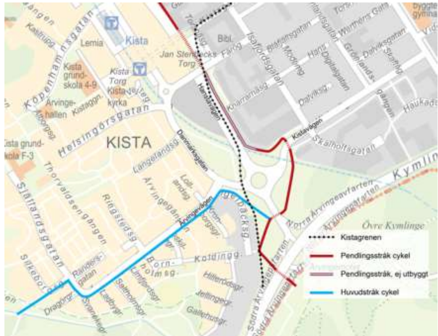
Bild 3. Kistagrenens planerade sträckning genom Ärvinge samt utpekade stråk för cykel

I samband med anläggandet av Tvärbanan får pendlings- och huvudcykelstråket i Ärvinge, söder om Danmarksgatan, en något justerad dragning. Huvudcykelstråket mellan Ärvingevägen och tunneln under Hanstavägen kommer korsa spårvägen i plan i anslutning till hållplats Ärvinge. Pendlingsstråket förskjuts något österut jämfört med idag, se bild 4.