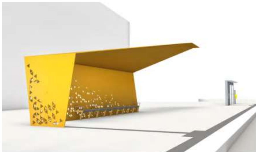
Bild 9. Förslag på gestaltade väderskydd på Jan Stenbecks torg (Rundquist)

Det nya torget ska ha en hög nivå på gestaltningen och ambitionen är att Tvärbanan hållplats ska bli en integrerad del av torget. Istället för Tvärbanans standardväderskydd ska omsorgsfullt gestaltade väderskydd placeras ut intill plattformarna. Väderskydden blir en viktig del av möbleringen av torget och tonar ner platsens funktion som trafikområde. Väderskydden bekostas av Staden genom dess trafiknämnd, se vidare under ekonomi, och kommer ägas och förvaltas av trafikkontoret.