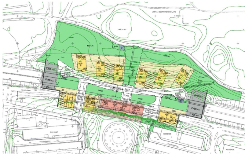
Detaljplan för Tenstaterrassen Dp 2015-17071.

En detaljplan för projekt Tenstaterrassen, bostadsbebyggelse vid överdäckningen i Tensta, planeras att antas sensommaren 2021. Det primära syftet med överdäckningen är minska den barriäreffekt som motorleden E18 utgör mellan Tensta och Järvafältet. Ett övergripande mål med överdäckningen av E18 är att göra Järvafältet mer tillgängligt för boende i området.