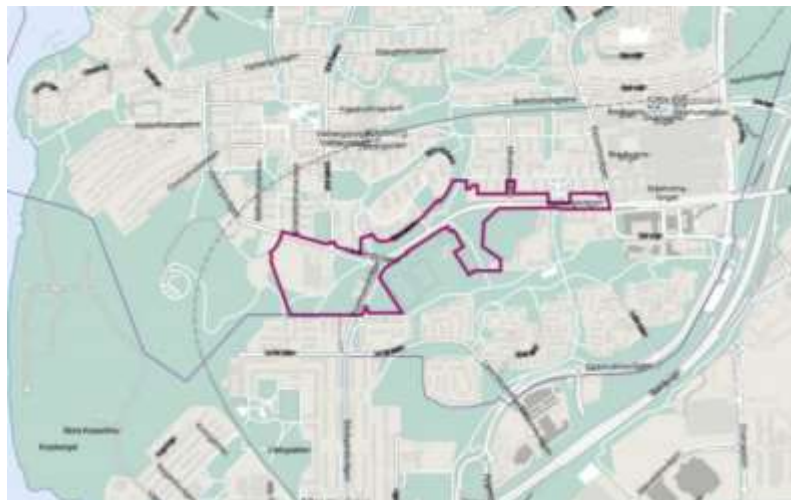
Figur 1: Planområdet markerat med lila linje.

Projektet syftar i huvudsak till att omvandla Vårbergsvägen till en stadsmässig gata där bostäder, publika lokaler och offentliga rum tillsammans skapar förutsättningar för en levande och trygg stadsmiljö som knyter ihop centrala Vårberg med centrala Skärholmen.