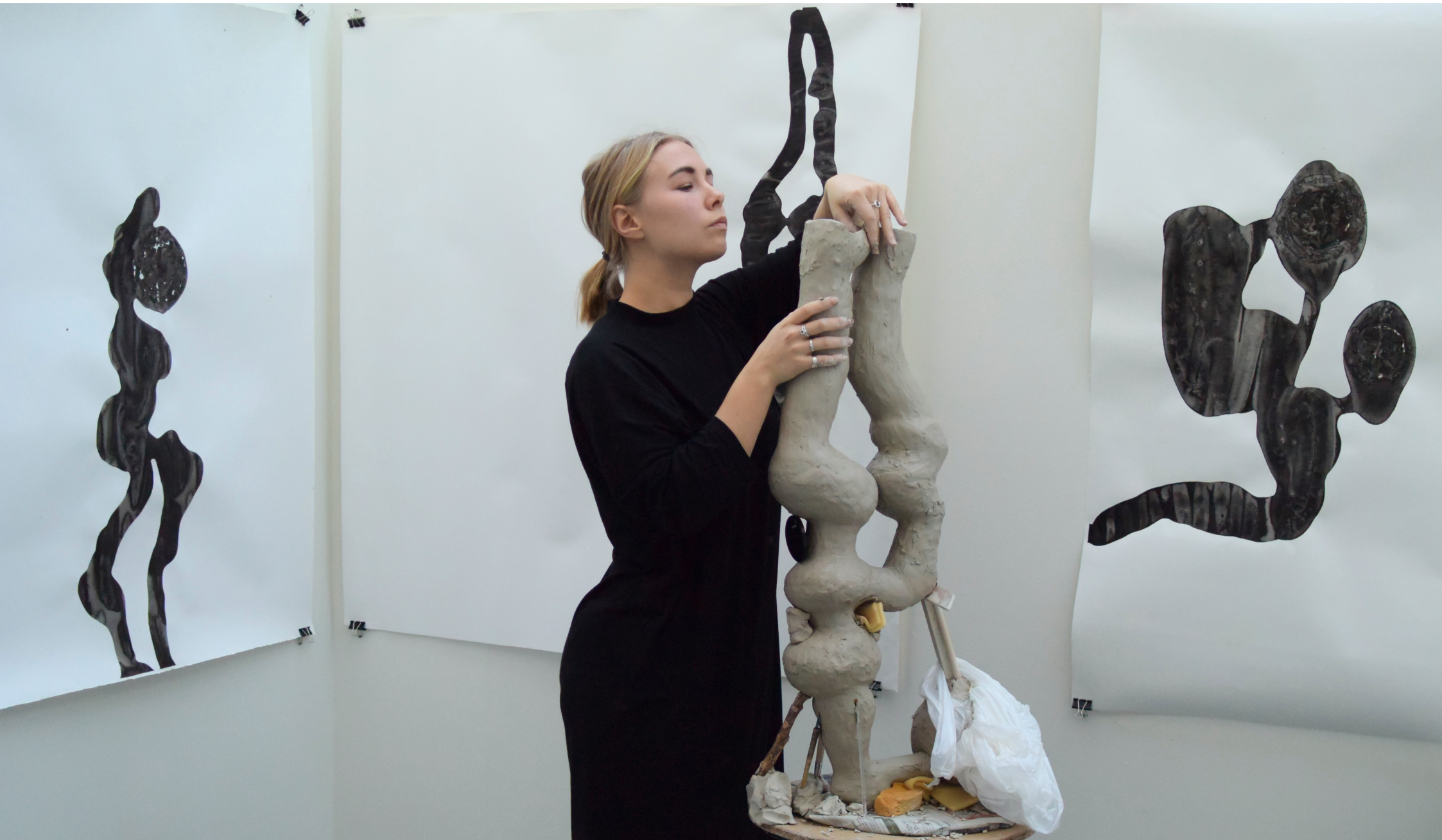
Processbild av skulptur under konstruktion. 2019.