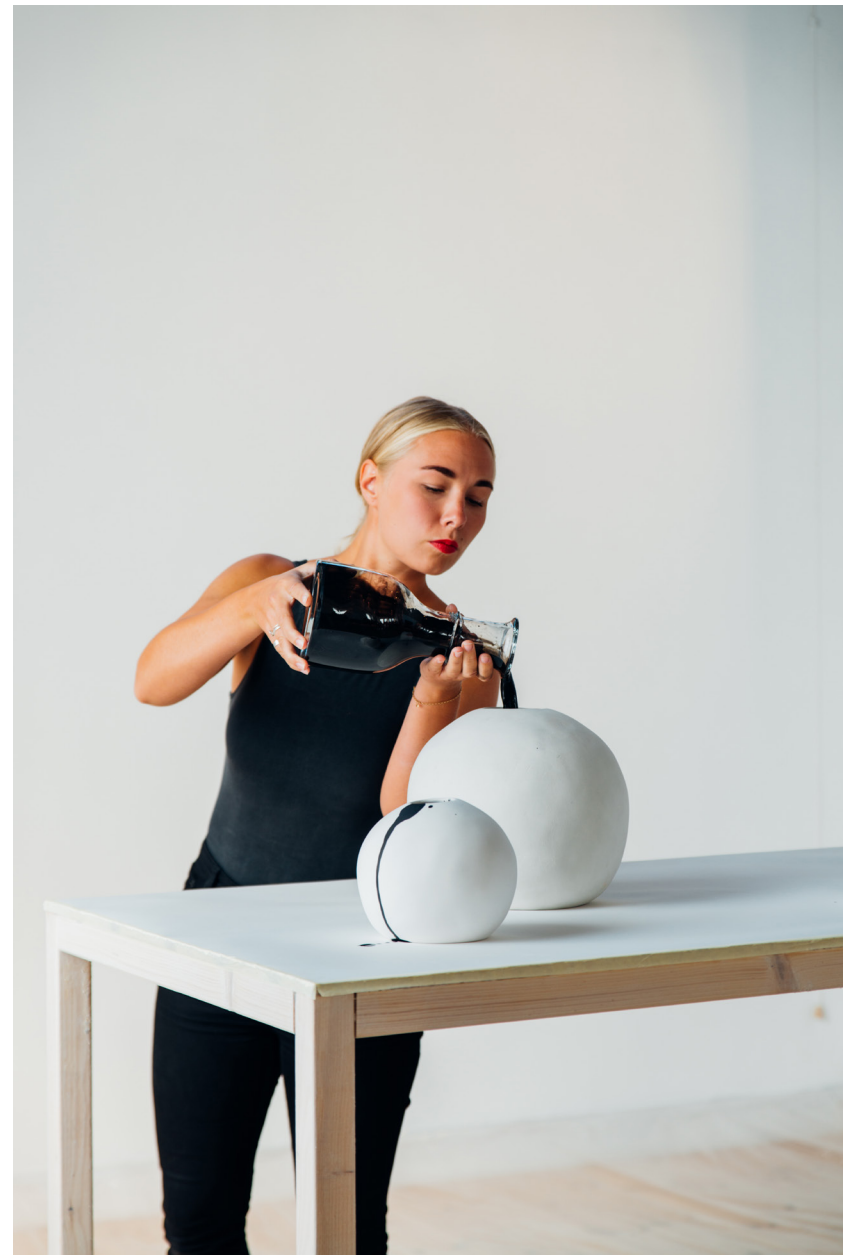
Dokumentation från presenterat performance vid Konsthallen Lokstallet sommaren 2018.