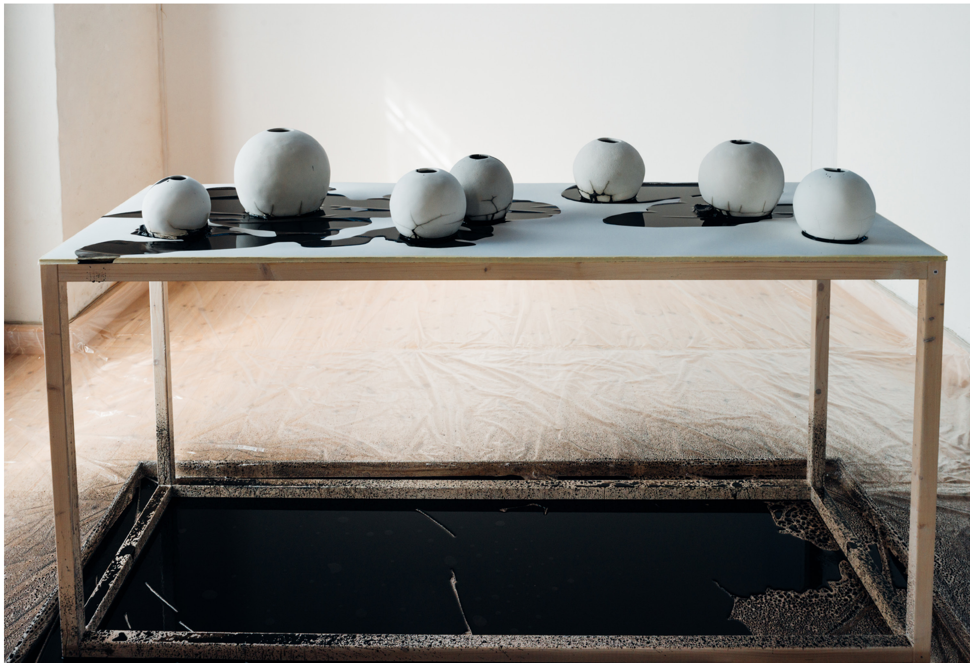
Ringlade obrända kärl i stengodslera, fyllda med vatten och tusch. Storlek på podie (ca): L:2 B:1 H: 1 (Meter)