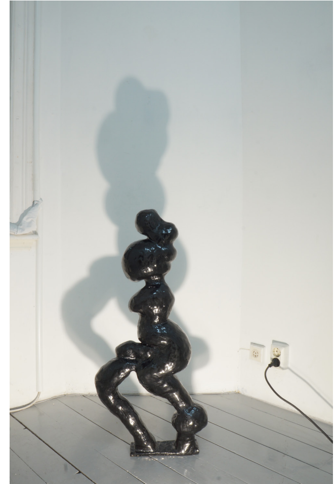
Skulptur presenterad under utställningen FLUKE på Galleri Rostrum i Malmö Januari 2020