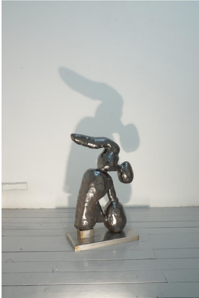
Skulptur presenterad under utställningen FLUKE på Galleri Rostrum i Malmö Januari 2020