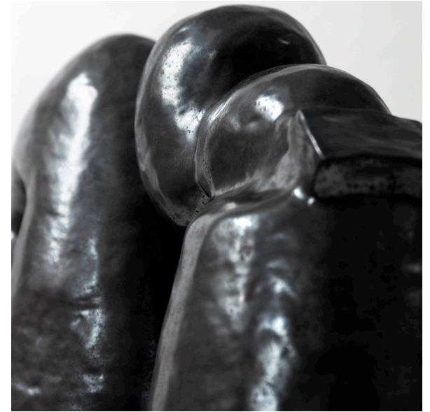
80 cm hög, 120 cm bred. Material: Ringlad skulptur i högbränd stengodslera. År: 2020