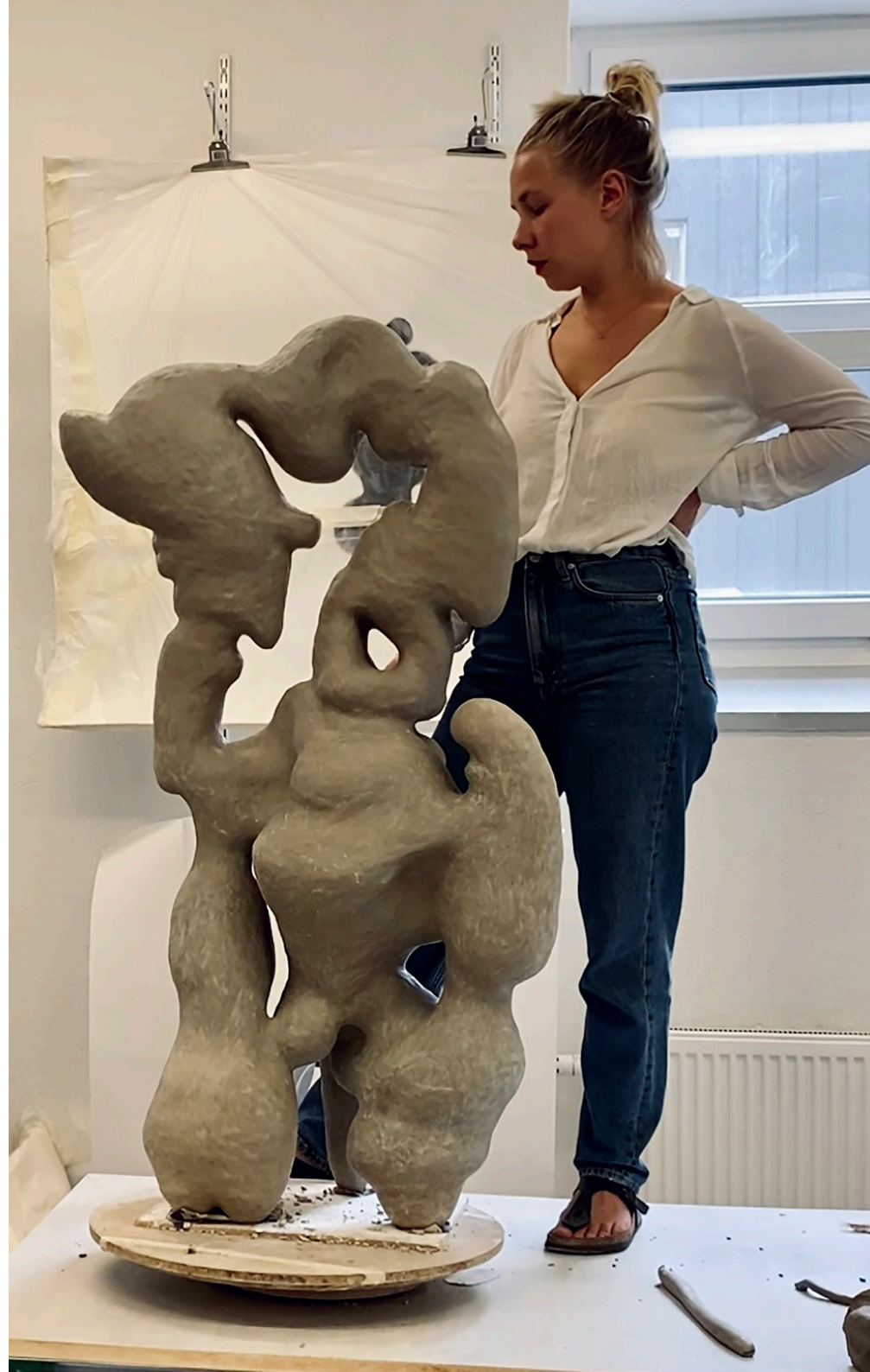
Processbild av skulptur under konstruktion. 2021.