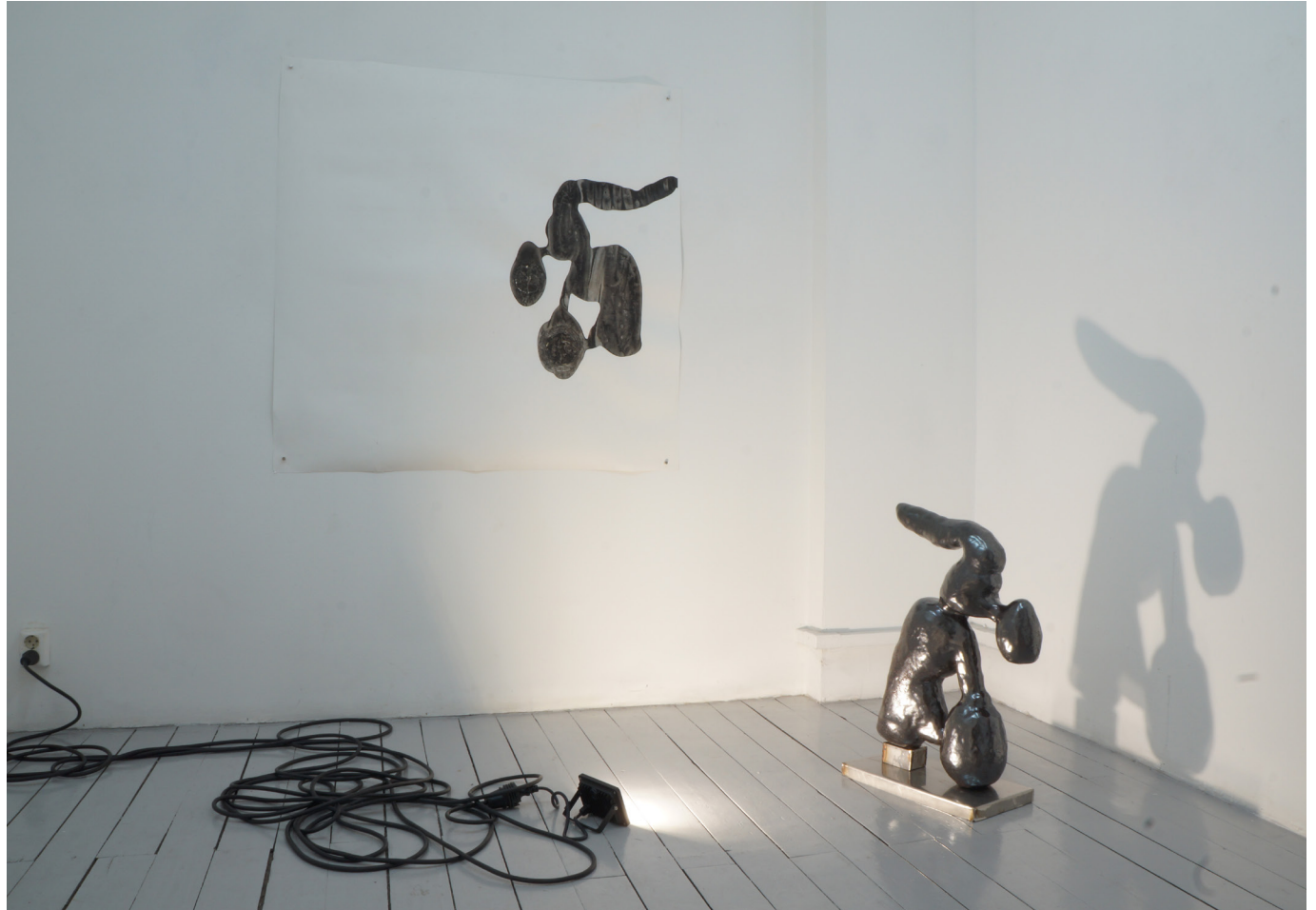
Mått måleri: ca. 120x120 cm Mått skulptur: 60 cm hög, 50 cm bred Material: Tusch på papper, högbränd stengodslera År: 2019