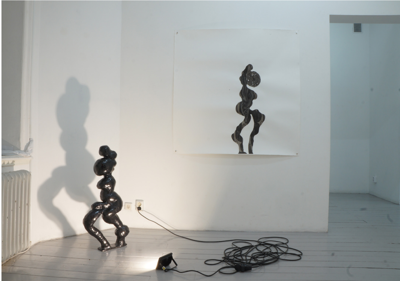
Mått måleri: ca 120x120 cm Mått skulptur: 85 cm hög, 30 cm bred på den bredaste punkten. Bottenplatta: 25 cm. Material: Tusch på papper, högbränd stengodslera År: 2019