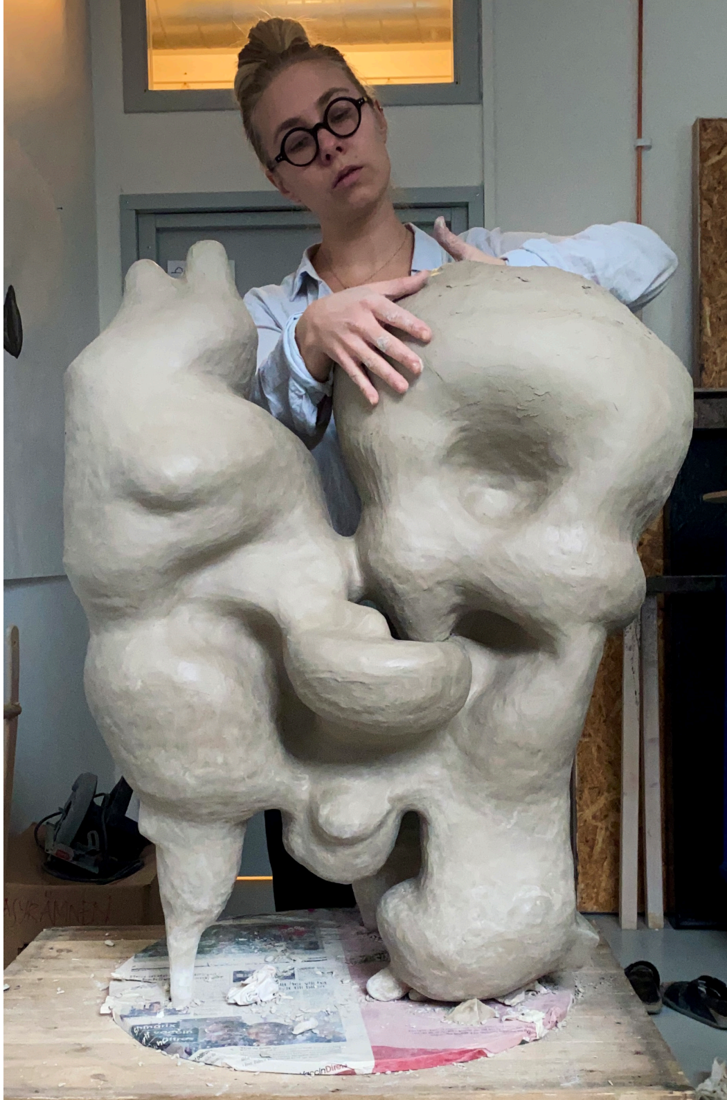
Processbild av skulptur under konstruktion. 2022.