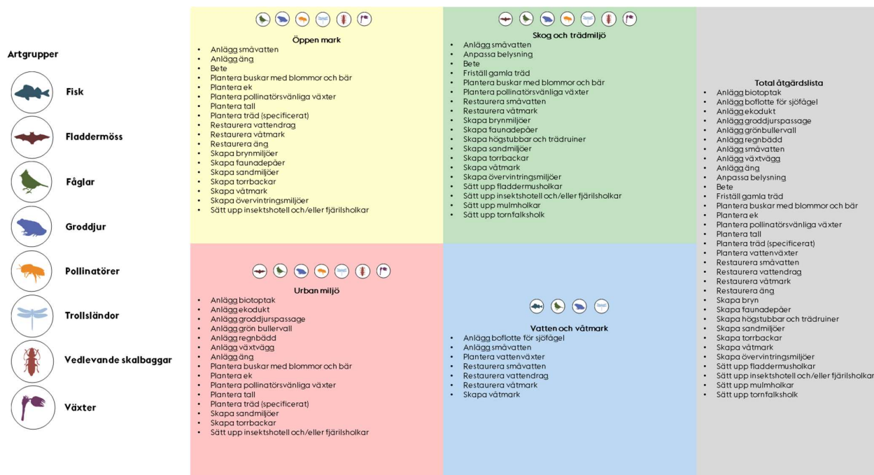
Figur 3. Kategorisering av åtgärdsförslag för olika artgrupper och i olika biotyper. Se större bild i rapporter över stadsdelsvisa åtgärdsförslag.