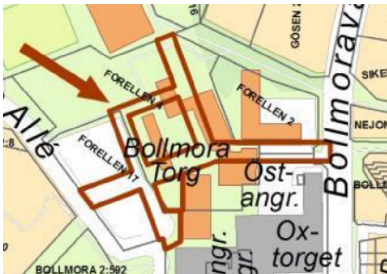
Kartbild 1: Planområdet etapp 1 Norra Tyresö Centrum