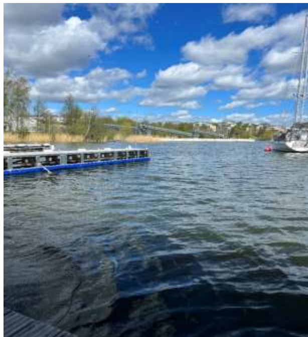
Anläggningsplats för båtbottentvätten vid Ulvsundavikens Varvsförenings hamn.