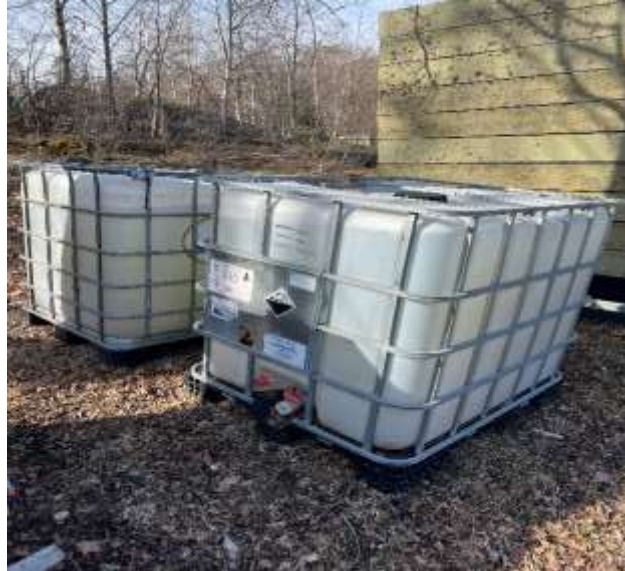
Tankar med slam från bassängen under båtbottentvätten.