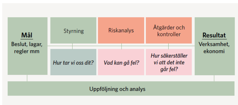
Bild 3 Beskrivning av arbetet med riskhantering

Varje nämnd och bolag ansvarar för riskhantering och intern styrning och kontroll inom sitt ansvarsområde. Nämndens och förvaltningens övergripande riskhanteringsplan ingår i nämnd- och förvaltningsplanen samt i respektive kontors/verksamhets- och enhetsplaner. Kommungemensamma risker kan hanteras i kommunplanen.