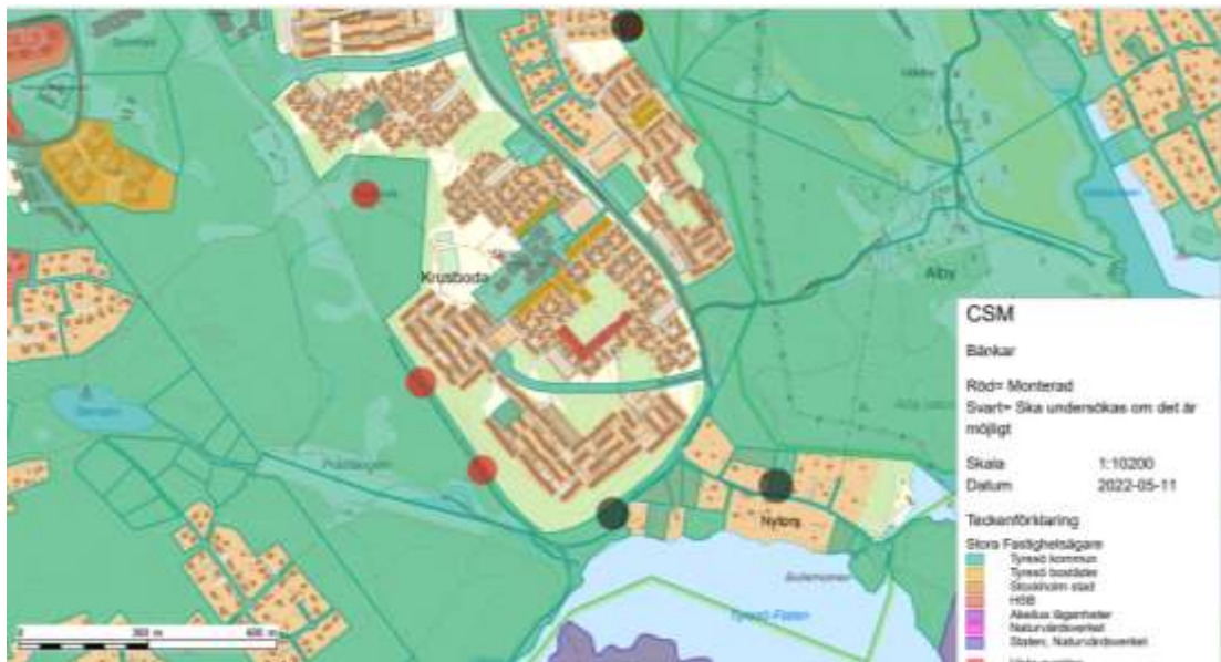
Kartbild som visar parkbänksplaceringar i Krusboda området.