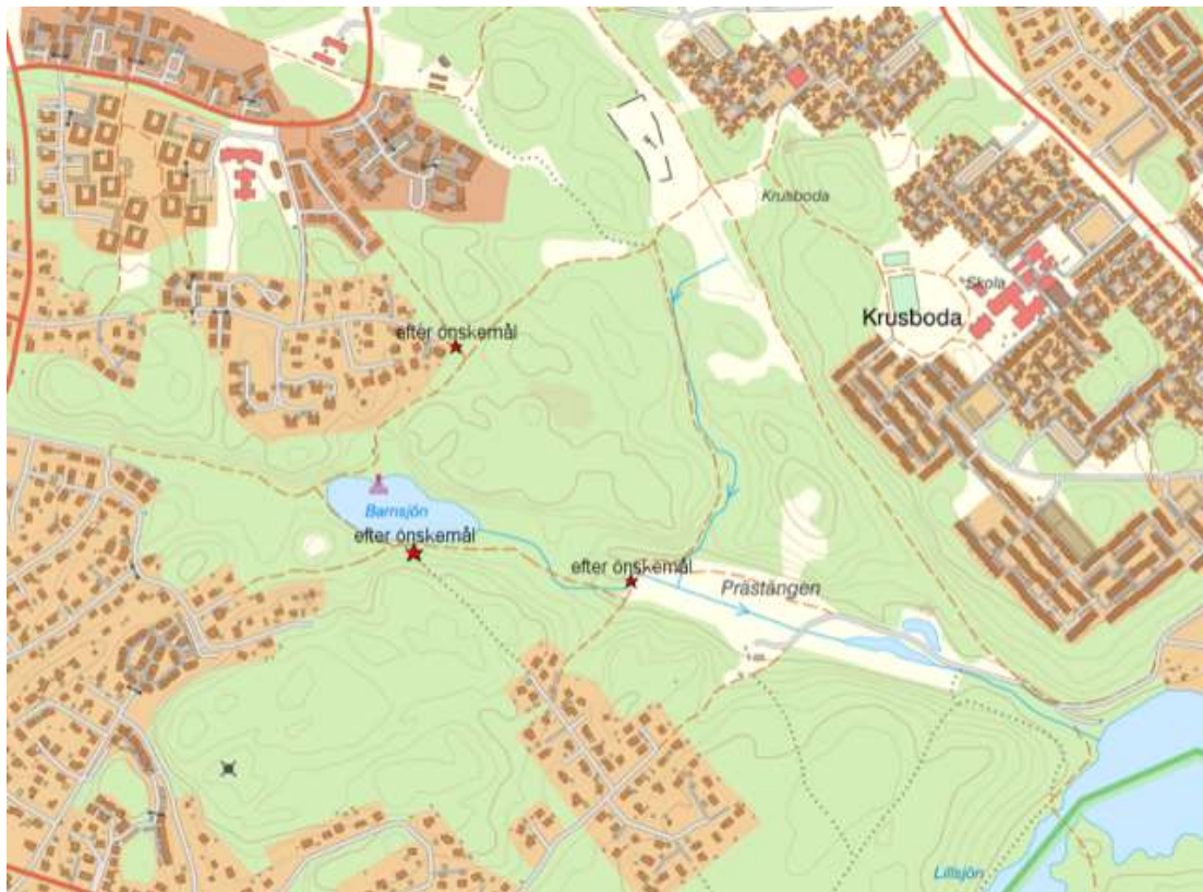
Kartbild som visar parkbänksplaceringar i området vid Barnsjön.