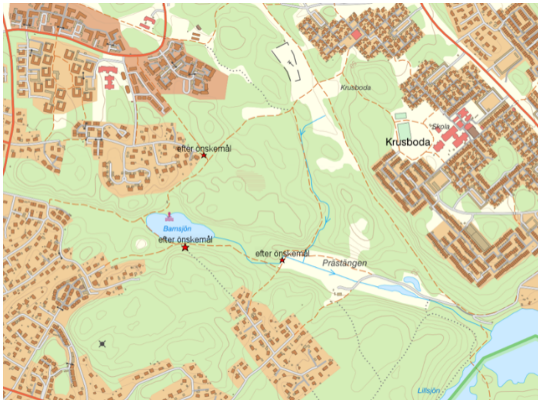
Kartbild som visar parkbänksplaceringar i området vid Barnsjön.