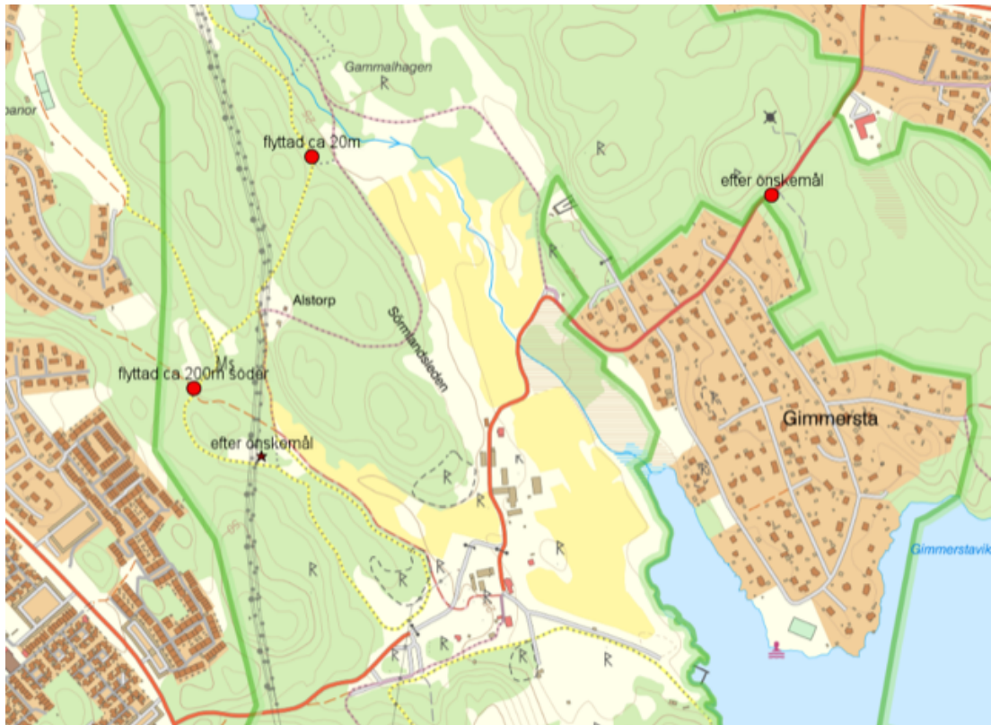
Kartbild som visar parkbänksplaceringar i Alby friluftsområde.