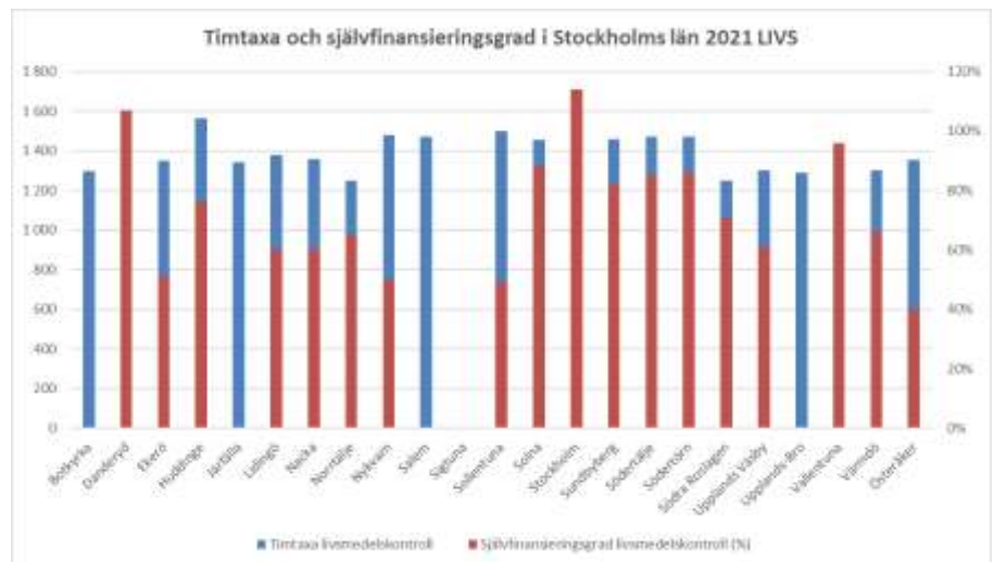
Figur 4: Relation mellan självkostnadsgrad och tiptaxan för livsmedelskontrollen inom Stockholms län år 2021. Botkyrka, Järfälla, Salem, Sollentuna och Upplands Bro har inte rapporterat självfinansieringsgrad för 2021. Notera att Stockholms självfinansieringsgrad för 2021 överstiger 100 % pga. statliga ersättningen kopplad till trängseltillsyn.