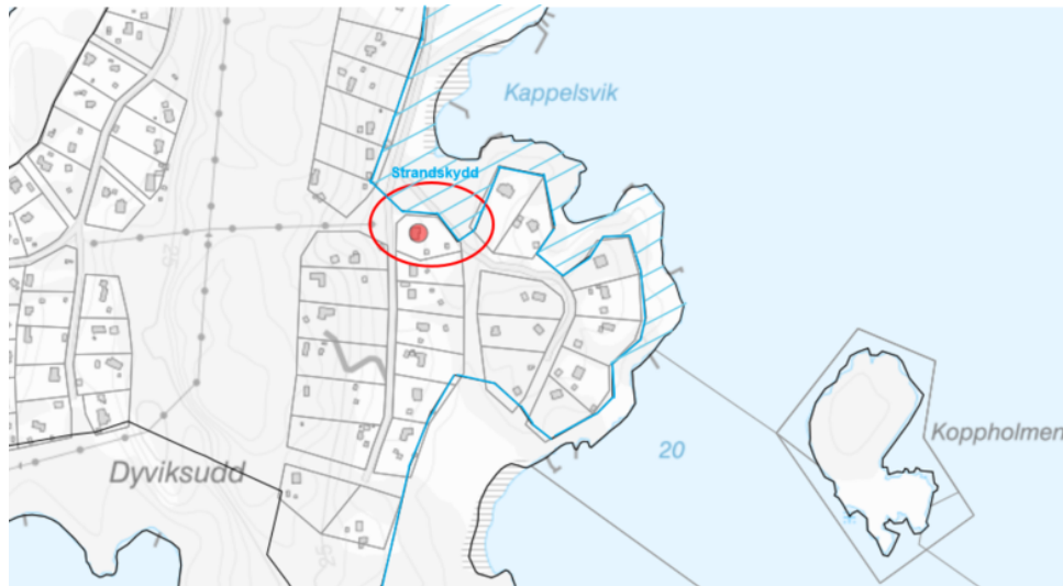
Bild 1 är ett utdrag ut kartdatabasen men aktuellt område inom röd ring och strandskyddslinje i blått.

Idag finns på platsen en luftledning som förser fastigheter på nordöstra sidan av Gränsöstigen med el.