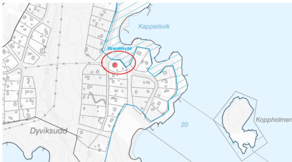
Bild 1 är ett utdrag ut kartdatabasen men aktuellt område inom röd ring och strandskyddslinje i blått.

Idag finns på platsen en luftledning som förser fastigheter på nordöstra sidan av Gränsöstigen med el.